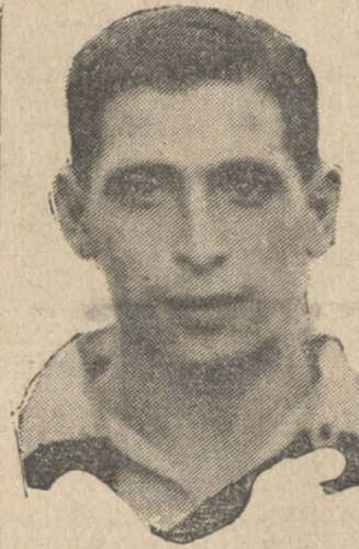
PEÑALILLO El notable half del Fernández Vial

El próximo domingo reaparecerá el Fernández Vial, en las canchas locales de fútbol. No lo ha hecho durante todo 1940.