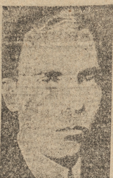
Vincent ASTOR es el jefe norteamericano de la gran fortuna de Astor, dinastía del dinero construida sobre una base inmobiliaria. El alza de los impuestos y la baja de los alquileres puede provocar la desaparición de esta gran fortuna.