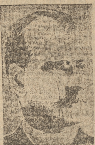
William C. WHITNEY, creador de la fortuna que pasó a sus hijos, Payne y Harry Payne Whitney. Esta fortuna, considerablemente reducida, está ahora en manos de la segunda generación. Ya no se la considera una de las grandes fortunas de los EE. UU.