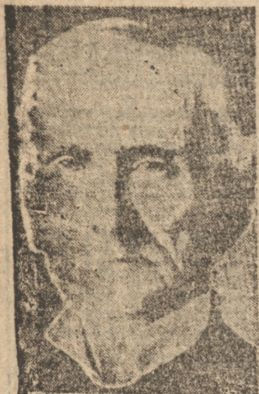
Thomas MELLON, que amasó el núcleo de la gran fortuna de Mellon, de la que hoy es jefe Andrew W. Mellon. Esta fortuna está hoy en la primera generación de la descendencia. Sus propietarios actuales la han aumentado considerablemente.