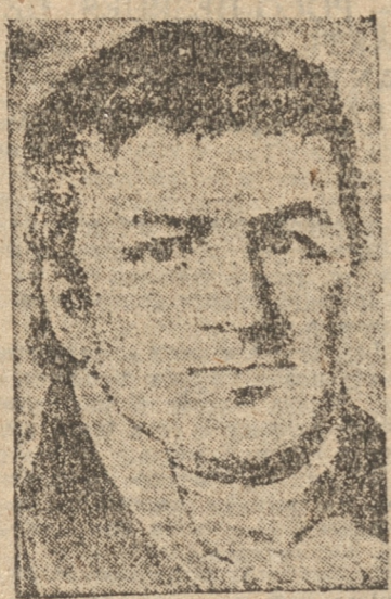
John Jacob ASTOR, fundador de la fortuna de Astor. Construyó una dinastía monetaria que todavía conserva proporciones considerables. Su base es la riqueza inmobiliaria en New York. Es la única de las grandes fortunas norteamericanas que tiene más de un siglo.