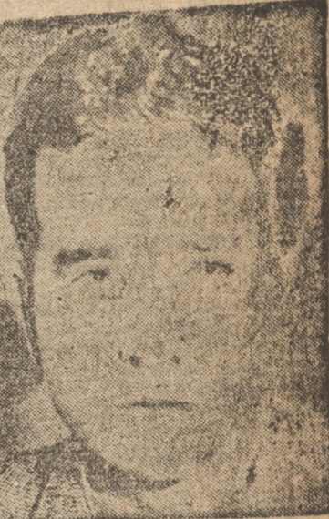
Cornelius VANDERBILT WHITNEY, poseedor de la fortuna de William C. Whitney en la segunda generación. Esta fortuna sigue siendo grande, pero ha sufrido varias fluctuaciones entre 1927 y 1931, perdiendo enormes sumas en algunas de ellas.