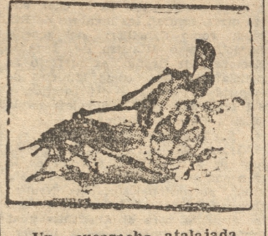
Una cucaracha atalajada.

siguiendo las curvas de la pista. Sirven de jinetes minúsculos muñecos o monitos de trapos, de distintos colores, y los jugadores — en modo especial las mujeres, que siempre vieron en el minúsculo peón la fiera más temible — ponen el dinero y el honor, el honor del que juega, a las patillas de quienes estiman un cachito de queso más que la riqueza y el honor humano. — Las cucarachas comparten con los ratones el amor de los verdaderos jugadores. Tirando de un minúsculo coche de dos ruedas, las competidoras — cuya domesticación es más difícil — recorren la pista con lentitud, haciendo más extensa la emoción de los que, en sus casas, manifiestan su amor por el repugnante bicho magnificado por el Vassari, al estudiar la personalidad de un pintor italiano, y por Anatole France, en un cuento inspirado en la página que el historiador amonizó con la presencia de los ortópteros. Nos olvidamos decir que las cucarachas de Argelia son más veloces que las francesas. Ya lo saben quienes quieran rozar de una emoción renovada súbitamente.