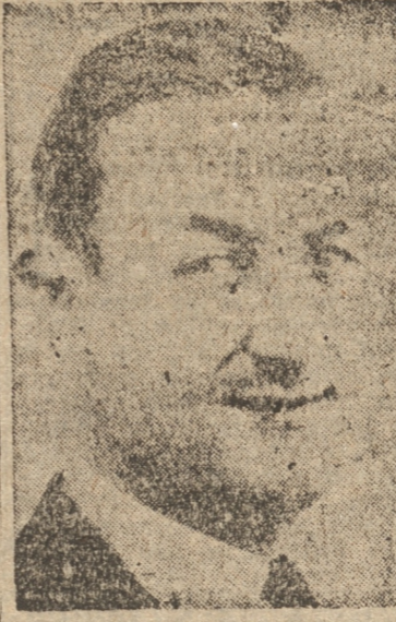
Paul MELLON, hijo de Andrew Mellon, ex secretario del Tesoro. La fortuna Mellon, dividida por Andrew, es una fortuna de familia, y algún día Paul será su jefe. Cuando llegue ese momento la fortuna estará en manos de la segunda generación.

Las fortunas que sobreviven a su fundador suelen durar hasta la generación inmediata. Generalmente comienzan a desintegrarse en la segunda generación y raras veces llegan a la tercera. Como ya hemos apuntado, de las grandes fortunas que existieron en los Estados Unidos sólo una conserva todavía proporciones considerables: la fortuna de Astor. Y aún ésta depende ahora del valor de las fincas urbanas, en New York. Si los impuestos suben y los alquileres bajan, toda la riqueza de Astor puede convertirse en cenizas.