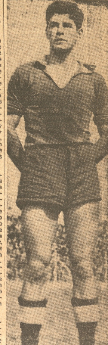
B A E Z A otro de los buenos jugadores aguerridos

del extranjero, aparezca un tanto rudimentaria, si se quiere. Pero la experiencia que todo el mundo sabe que tarde o temprano puede que todavía nuestros principales clubes profesionales entren por el verdadero sendero que la práctica y los resultados nos están mostrando diariamente. — G. ABRIL, Corresponsal.