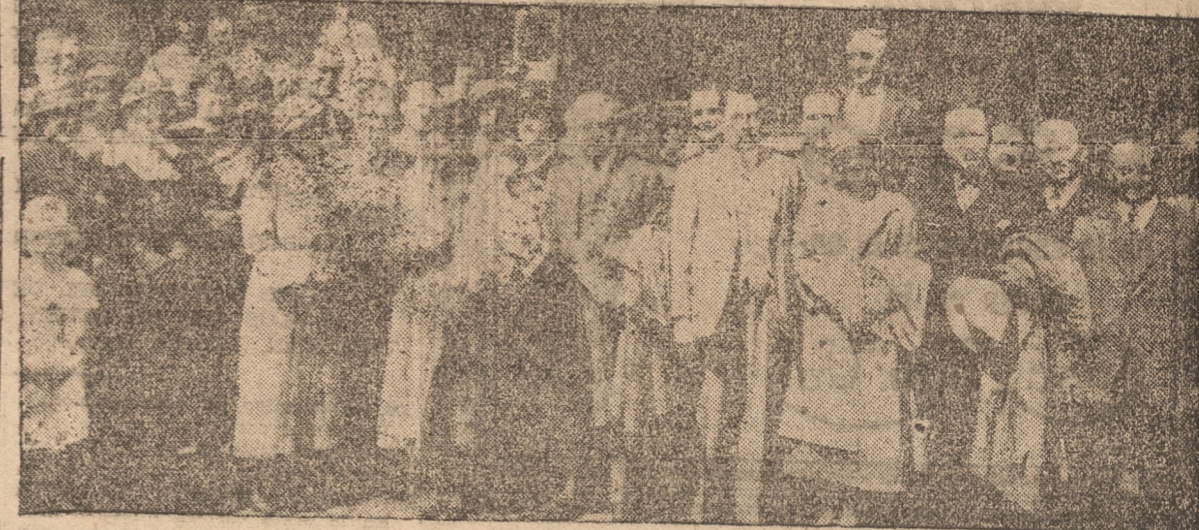
EL EMBAJADOR SEÑOR PEDRAZZI, Y COMITIVA A SU LLEGADA A LA ESTACION