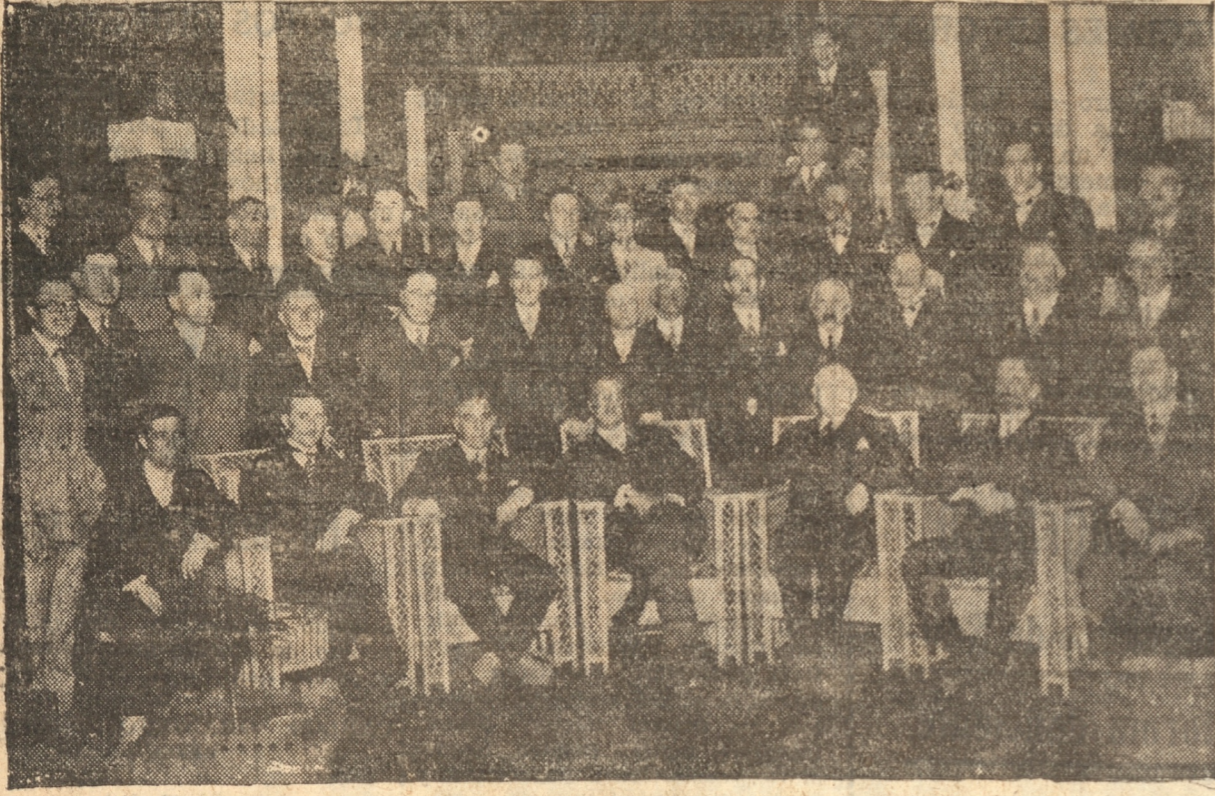
155 ASISTENTES AL BANQUETE DE ANOCHE EN EL HOTEL DE FRANCE

En este banquete se hicieron gratos recuerdos de la patria lejana, prolongándose la charla, hasta cerca de la medianoche.