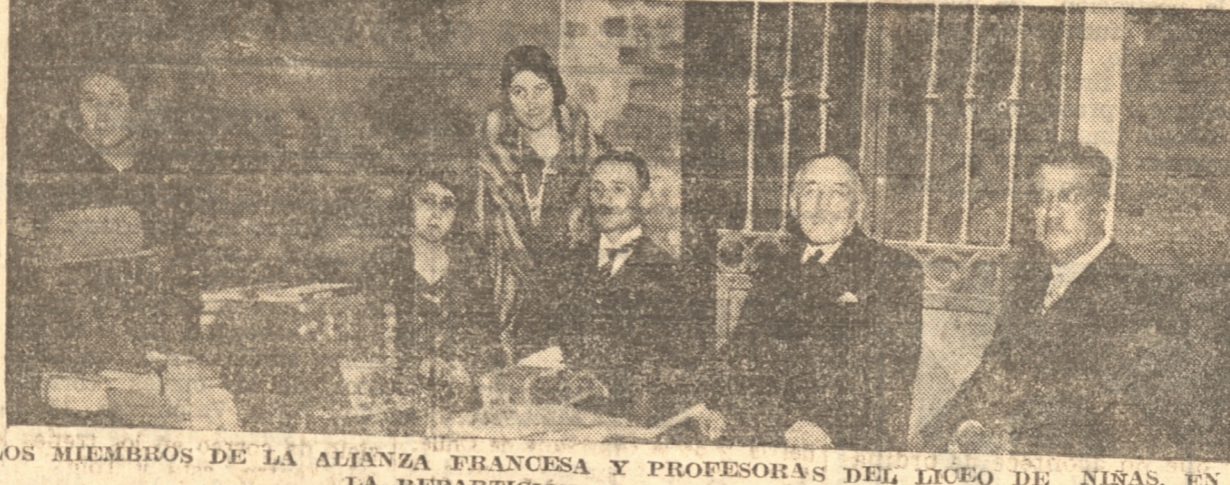
LOS MIEMBROS DE LA ALIANZA FRANCESA Y PROFESORAS DEL LICEO DE NIÑAS, EN LA REPARTICIÓN DE LOS PREMIOS