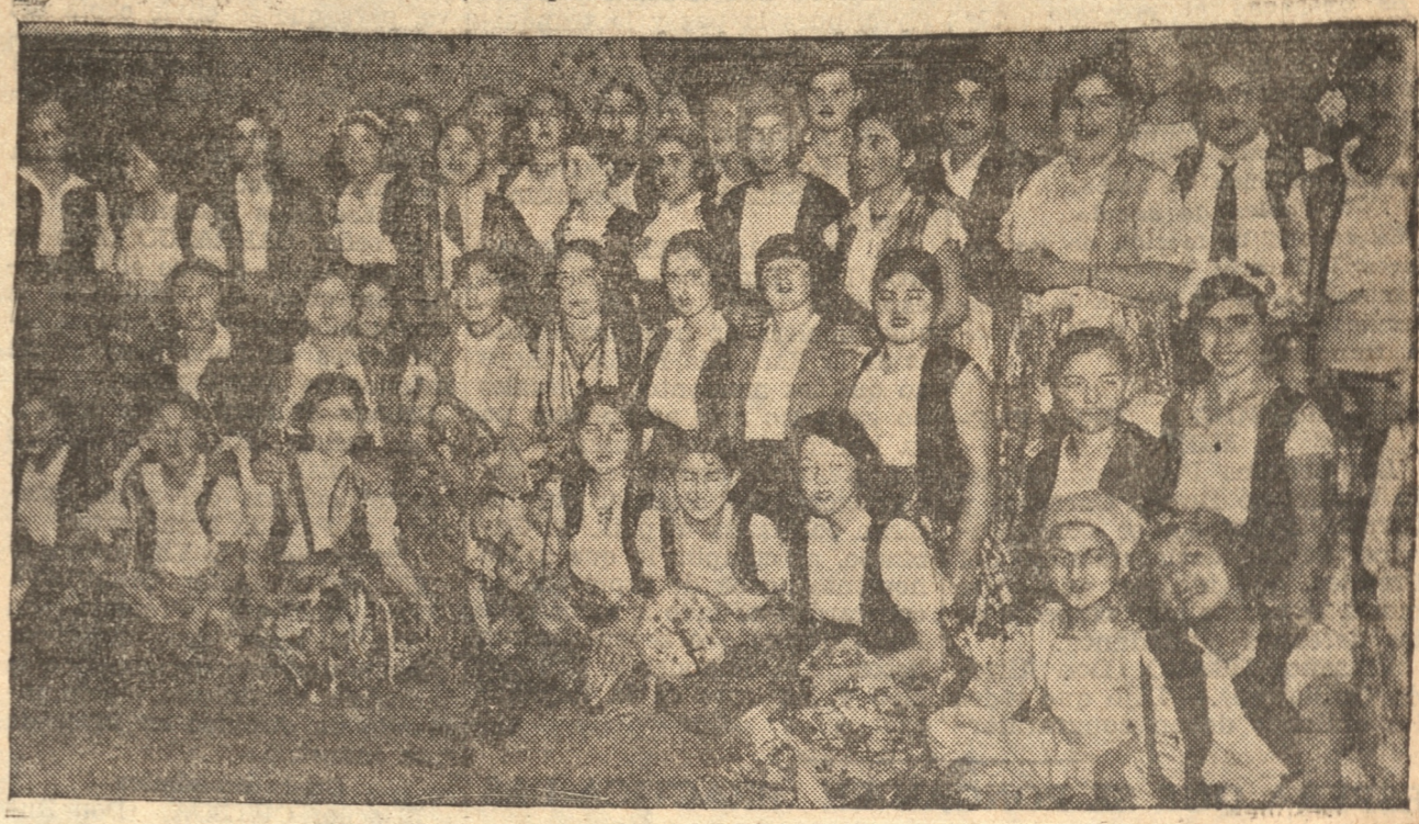
ALUMNAS DEL LICEO FISCAL DE NIÑAS QUE PARTICIPARON EN UNO DE LOS NUMEROS MAS BRILLANTES DE LA VELADA