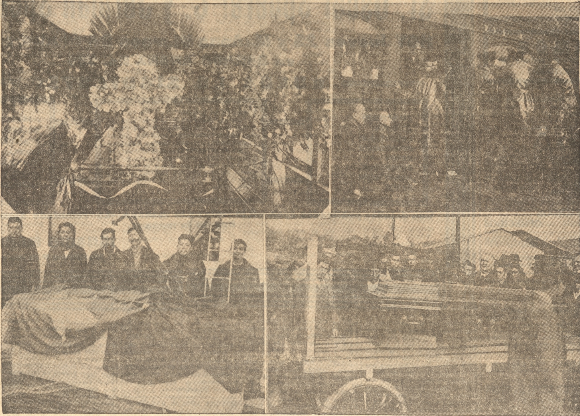
1) LA CAPILLA QUE SE LE ERIGIO EN EL TREN ESPECIAL PARA TRASLADAR LOS RESTOS A LOTA. — 2) EN EL MOMENTO DE EMBARCAR LOS RESTOS EN EL TREN ESPECIAL. — 3) A BORDO DEL "SANTA MARIA" POCO ANTES DEL DESEMBARQUE. — 4) EL TRASLADO DEL EXTINTO HACIA LA ESTACION DE LOS FERROCARRILES.

Brigada de Boy Scouts, Colegio de Niñas Santa Filomena, Escuela Completa de Mujeres N.º 8, Escuela Incompleta de Mujeres N.º 11, Escuela Mixta N.º 21, Escuela Completa de Hombres N.º 6; Escuela Incompleta de hombres N.º 4; Colegio de Niños San Juan, Escuela de Hombres "Matías Cousiño", Escuela de Niñas "Isidora Cousiño", carro con coronas, banda del Establecimiento de Lota, estandarte y directorio del Cuerpo de Bomberos, carro mortuorio, deudos, autoridades y personal de empleados, sociedad de señoras "La Ilustración", centro femenino "Patria y Hogar", sociedad de señoras del "Sagrado Corazón", Cruz Roja Juvenil del centro Patria y Hogar, banda Municipal Sindicato del Establecimiento de Lota, Federación del Trabajo, Sociedad de S. M. Artesanos y Obreros, sociedad de S. M. Fundición de Cobre, sociedad de Pescadores Juan J. Latorre, sociedad de S. M. Unión y Fraternidad, sociedad de S. M. Unión Marítima, sociedad de S. M. Carlos Condell, sociedad de S. M. Gran