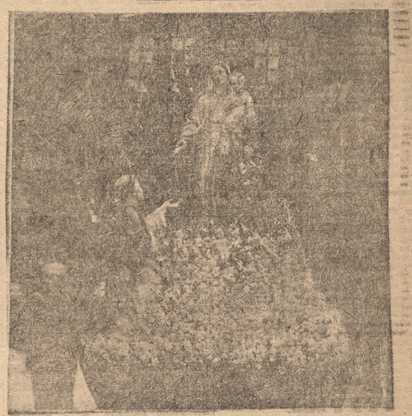
EL ANDA DE LA VIRGEN DEL ROSARIO, EN LA PROCESSION D E AYER

Un realce extraordinario tuvo en el día de ayer la procesion en honor de la Santísima Virgen del Rosario que salió desde el templo de Santo Domingo y recorrió las calles próximas a esta parroquia. Numerosos fieles participaron en este homenaje a la Virgen del Rosario y un considerable número de casas de las calles por las que pasó la procesion, fueron artísticamente adornadas en sus frentes. En la procesion asistieron la presencia de dignidades eclesiásticas, instituciones católicas y una enorme concurrencia de fieles.