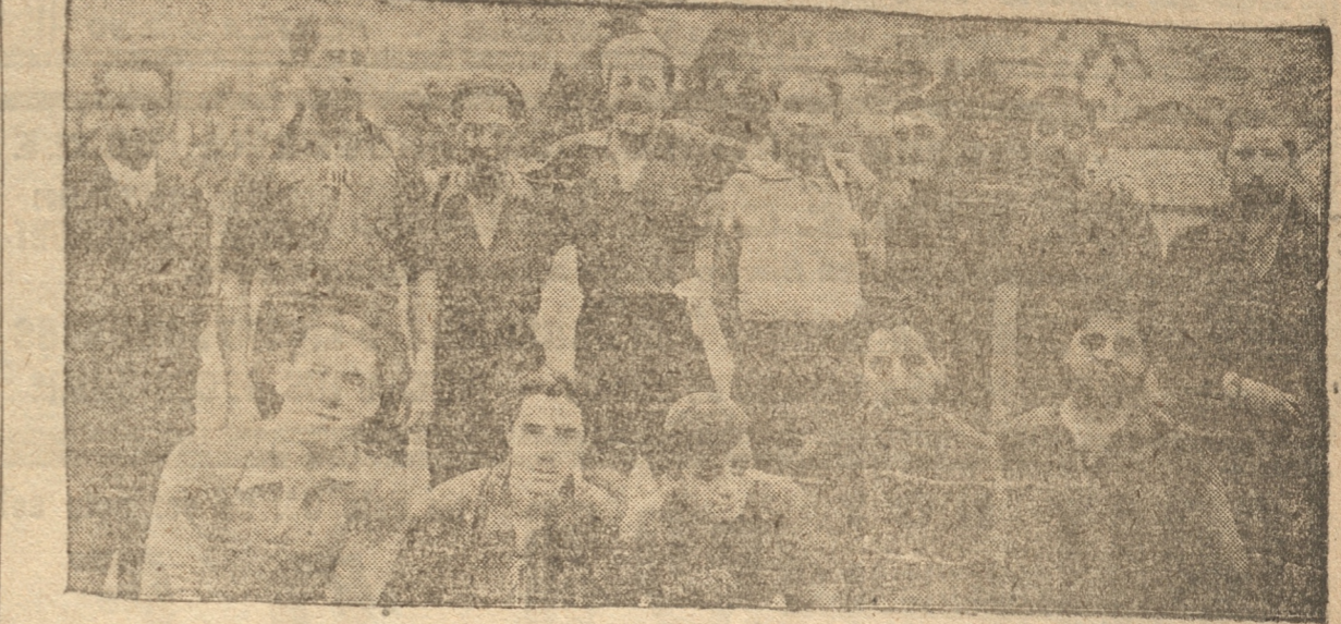
Equipo de Grace y Duncan Fox Unidos, ganadores de la competencia Relámpago, de la Liga Comercial de Deportes que se terminó ayer

El team de Herman y Huth se clasificó segundo