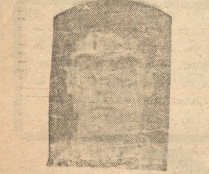
V. ARAVENA, un half de méritos de Lota

10.30 horas: Cochrane A - Cochrane B, sexta división.