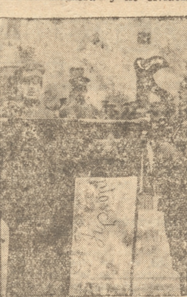
Un alicerce jurando.

te, cumplidores de los deberes. Tened presente la grandeza de esta ceremonia, la importancia y significación del compromiso que vais a contraer; recordad que desde la inmortalidad os contemplan nuestros muertos gloriosos que todavía montan guardia de honor anunca, que ella es el símbolo de su bandera y no olvidéis