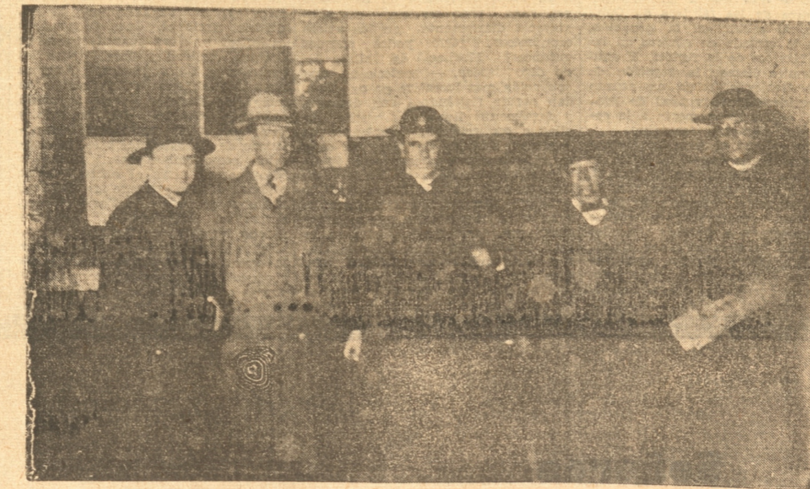
El Obispo de Valdivia, monseñor Eugenin, a su llegada anoche a nuestra ciudad