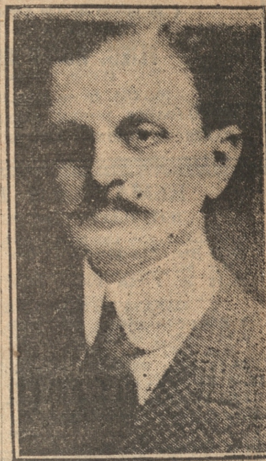
MAS, que se manifiesta pesimista respecto de los resultados de las gestiones pacificadoras del Chaco

El Canciller Saavedra Lamas declaró a la salida de la reunión: "No hay noticias de importancia".