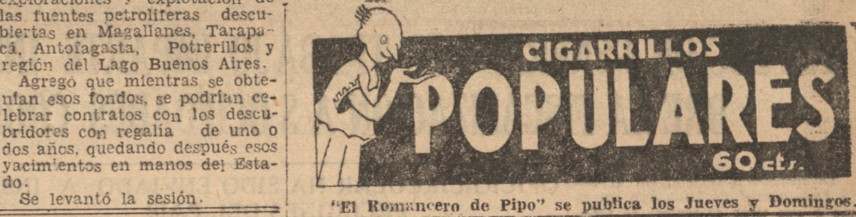
"El Romancero de Pipo" se publica los Jueves y Domingos.

MENJOUES EN REMOJO La Mutua de Bigotudos ha resuelto desde hoy día dejar en la barbería sus ideales patilludos. Bigote, barba o chuleta, todo adorno de la geta, les impiden que abundante penetre a sus naricillas el perfume del fragante Populares con boquillas. Declaran los ex-fanáticos del bigote y la patilla, que ahora, así afeitados, hasta la misma coquilla fumarán los aromáticos Populares ovalados.