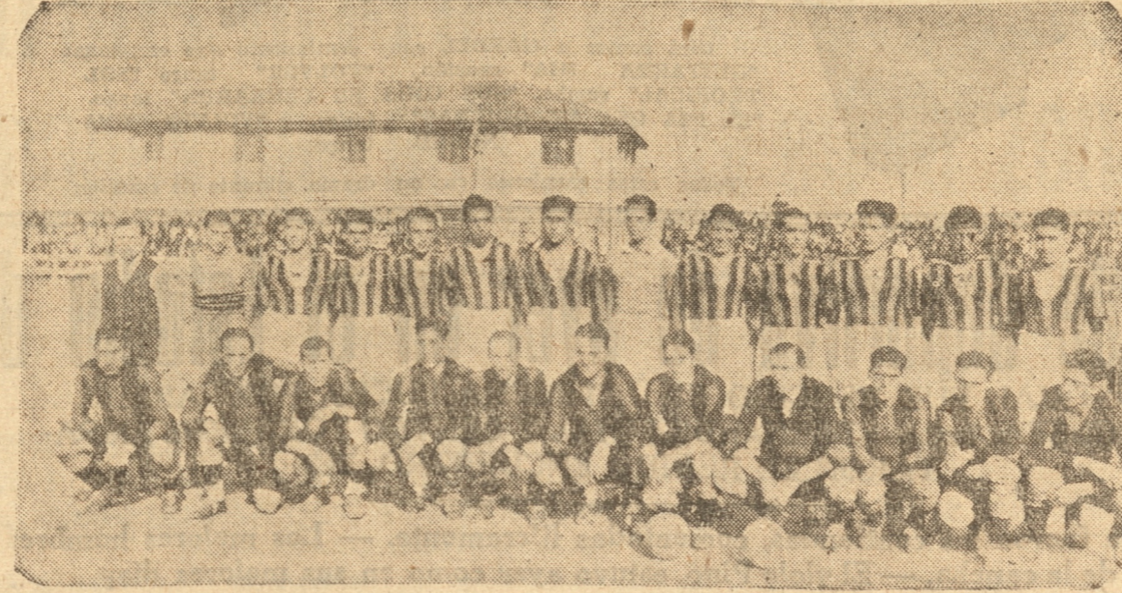
VIALINOS Y PORTEROS DEL TOR NEROS POSAN PARA "LA PATRIA" AYER EN TALCAHUANO ANTES DE DAR COMIENZO AL GRAN PARTIDO QUE JUGARON

En Schwager debutó ayer un nuevo team que cuenta con buenos valores del fútbol de ese mineral. Se enfrentó el Alianza este con el team de los guerrilleros de Lota y se al Manuel Rodríguez a quien ganó por la cuenta de cuatro a uno en un partido de mucho interés y donde se vieron buenas jugadas por cada bando.