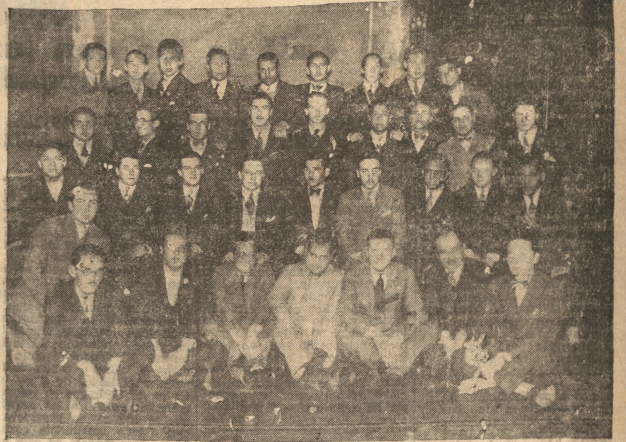
GRUPO DE LOS ASISTENTES A LA COMIDA EN HONOR DEL DOCTOR DON ENRIQUE GONZALEZ PASTOR

Ofrecieron anoche los alumnos del tercer y cuarto años de la Escuela de Me- dicina, en los comedores del Centro Catalán