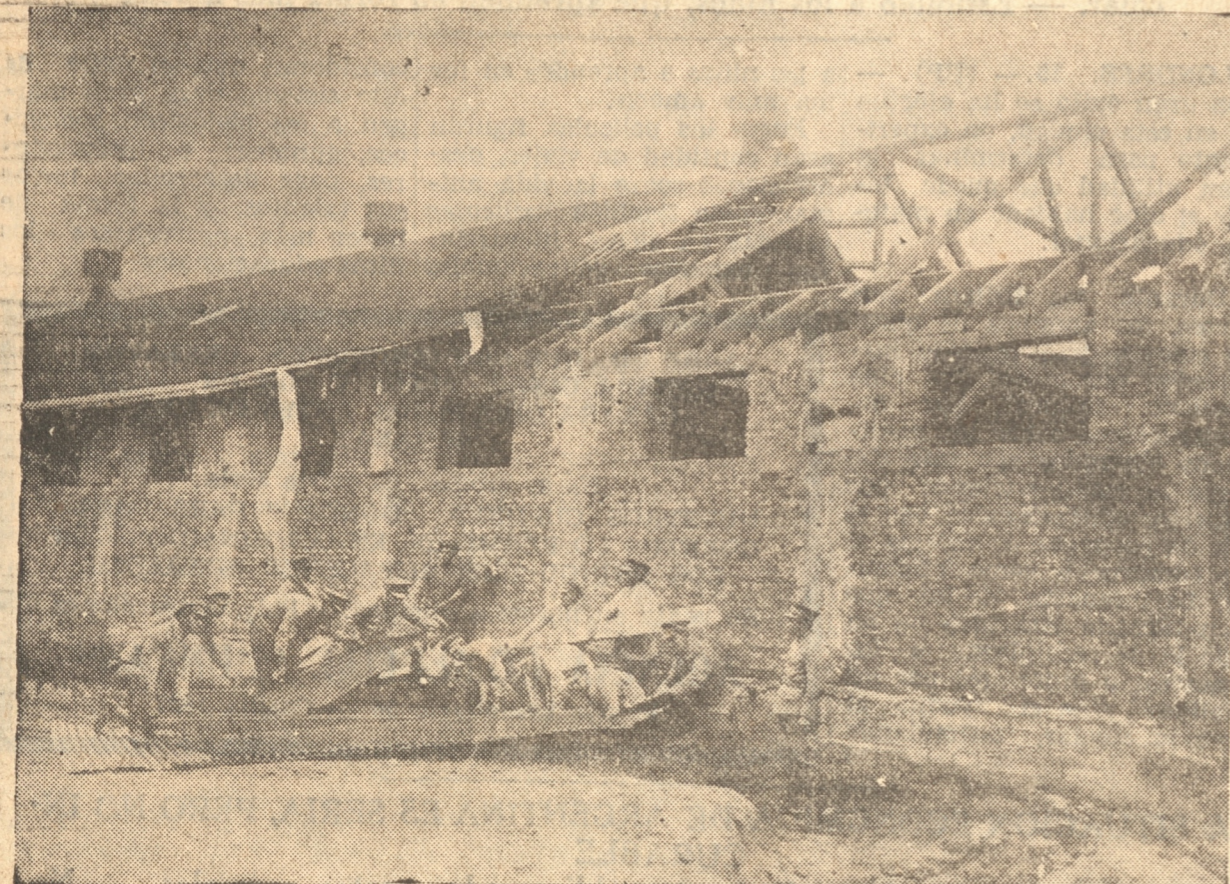
ESTADO EN QUE QUEDO EL TECHO DE LA 4.ª NAVE DEL REGIMIENTO GUIAS