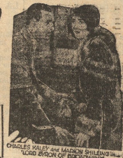
CHARLES KALEY and MARION SHILLING in "LORD BYRON OF BROADWAY"

Coros espléndidos, escenas revisteriles en colores a cargo de las mejores bailarinas de Broadway, las que no hallan rival en ninguna película