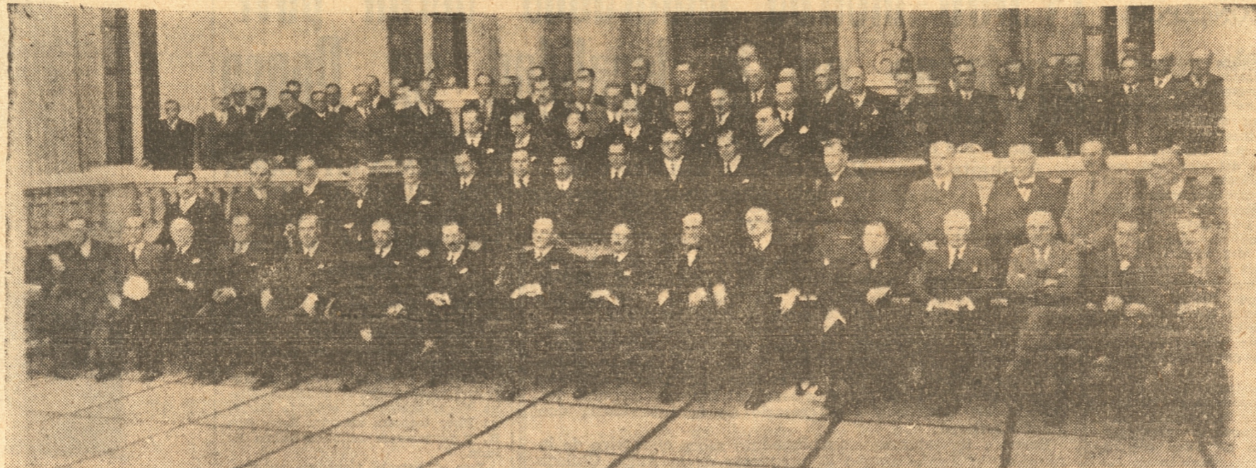
DAMOS ESTA FOTO DONDE APARECEN LOS ASISTENTES A LA MANIFESTACION QUE EL DOCTOR DON FERNANDO ALLENDE NAVARRO OFRECIO A LOS DELEGADOS DE LA PROVINCIA DE CONCEPCION A LA RECIENTE CONVENCION NACIONAL Y SOBRE LA CUA L. DIMOS OPORTUNAMENTE TODOS LOS DETALLES