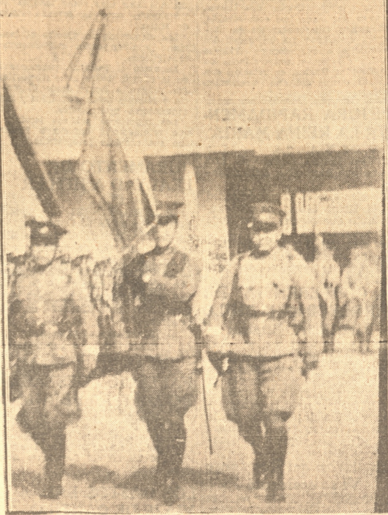
Tres aspectos de la celebración del Día del Carabinero en nuestra ciudad. — En uno aparecen los asistentes al almuerzo en el cuartel de la V Comisaría, y en los otros mientras se entregaba la medalla a uno de los carabineros como premio por años de servicio y durante el pase de la bandera, en la ceremonia de la Promesa de Servicio, que tuvo lugar en el cuartel de 4.ª Comisaría.