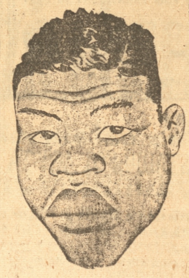
JOE LOUIS Mientras no peleé la revancha con Schmelling no es un real campeón del mundo de box de todos los pesos

Desde que Gene Tunney se retiró invitó del campeonato mundial no se puede decir que ha habido un campeón indiscutible. Joe Louis, el más fresco de los felices del ring, no es una excepción, con todo y que sin duda alguna es mejor campeón que sus predecesores. Aunque la culpa no es del impetuoso "bombardeo", a quien nadie puede acusar de haber forzado, a punta de revólver, a James J. Braddock, a que le volviera la espalda a su legítimo "challenger", Max Schmelling, para concederle a él (Joe) la prioridad. Y aquí hay una buena ejemplo del exceso de codicia, a que me refiero por parte de los "managers" de las figuras principalmente de Pugilística. A Braddock le ofreció un promotor de Berlín $ 350 000 para un combate con el campeón absoluto de los pesos pesados, además de viajes y "training", para que fuera a Alemania a defender su título contra Max Schmelling. Y el campeón rechazó la oferta para pelear en Chicago con Louis... Ya hemos visto cómo, después de deducidos de los $ 350 000 que le tocaron los impuestos de