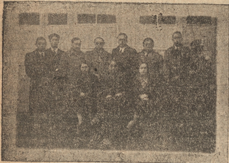
PERSONAL DE LA CAJA DE SEGURO OBRERO

Cuenta el Cuerpo con un buen material, compuesto de tres máquinas, dos de ellas automóviles, que facilitan la benéfica labor de los voluntarios en los casos de incendios.