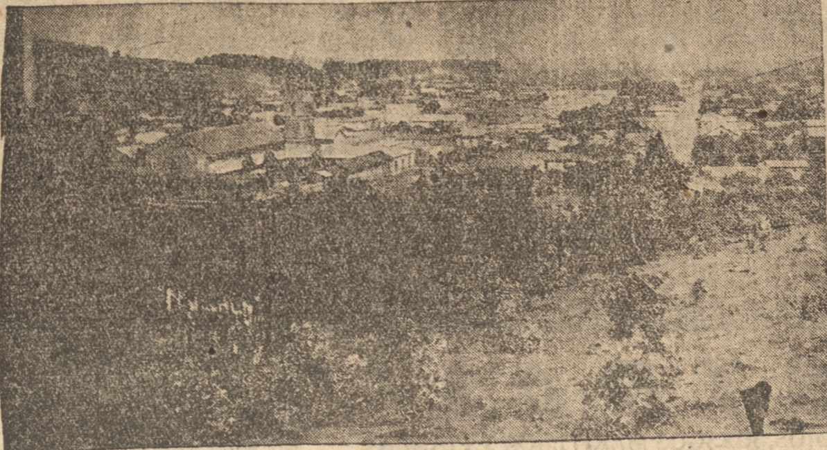
VISTA PANORAMICA DE MULCHEN

Puso término a la Asamblea Monseñor Rafael Piedra en medio de los aplausos y vitores de la concurrencia que de pie saludó al distinguido sacerdote que supo captarse la simpatía y admiración de todo el pueblo. Exhortó en conmovedoras frases a perseverar en el