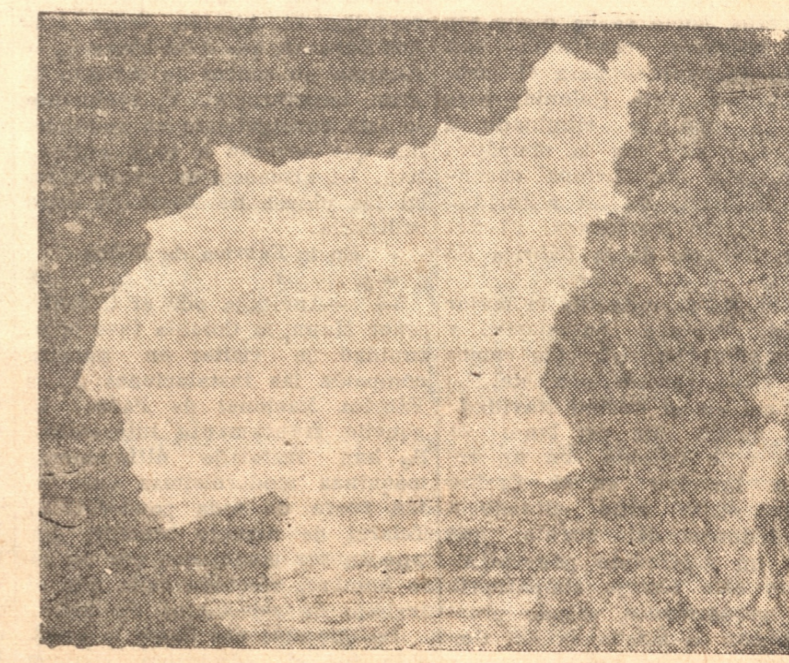
HERMOSA ROCA A LOS PIES DEL FUERTE DE SAN VICENTE