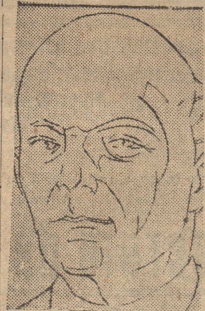
Señor Gustavo Ross, actual ministro de Hacienda, a quien se daba pa- ra la Cartera de lo Interior