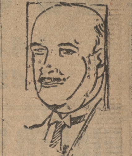
Ministro del Interior, señor Luis Sa- las Romo, cuya renuncia des- mintió el Gobierno

las Romo, por su constante acierto en el manejo de los negocios que ocurren en la Cartera del Interior, goza de la más absoluta y amplia confianza del Presidente de la Re- pública por cuyo motivo lo acom- pañará durante todo el tiempo que resta de su Administración.