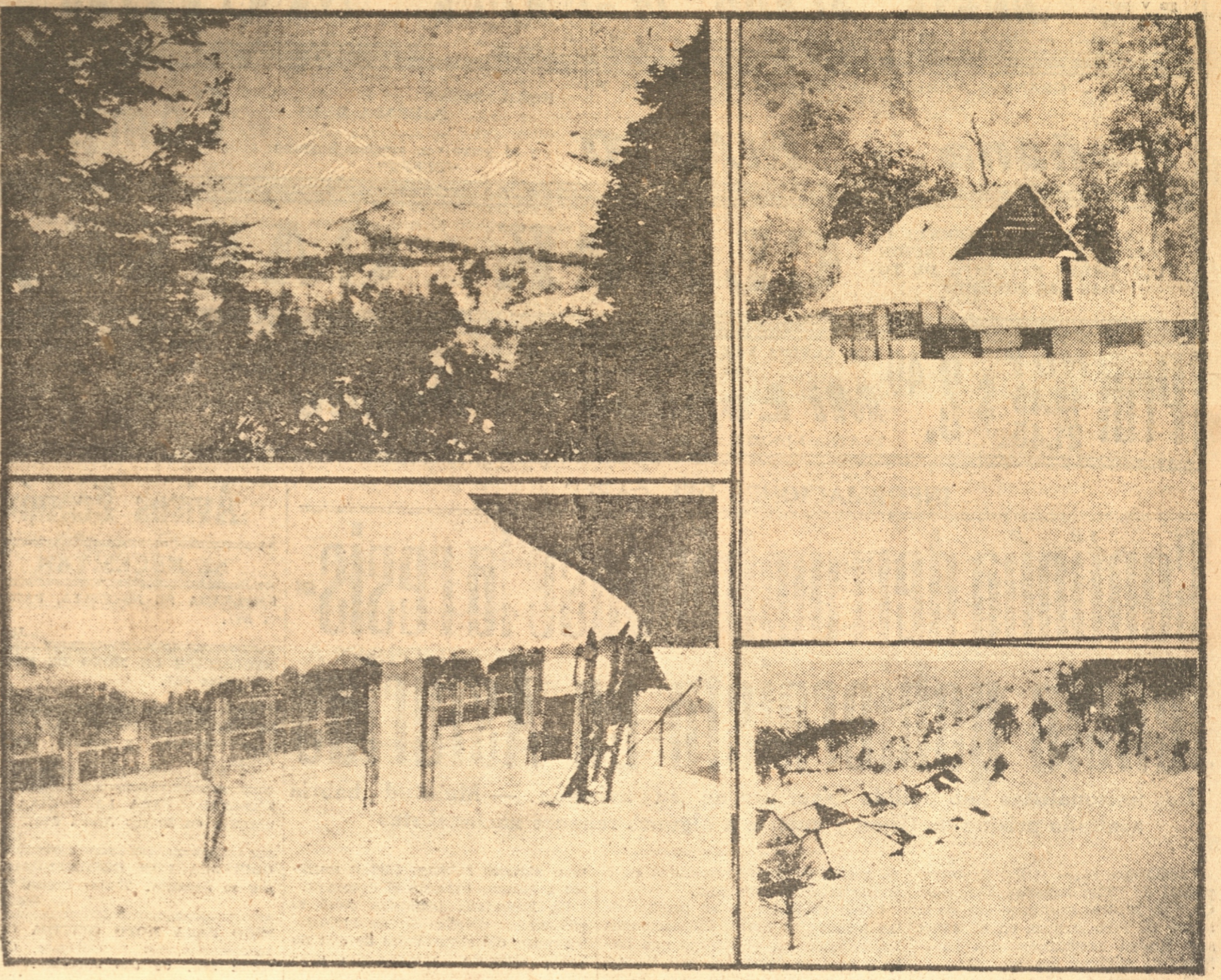
EL DEPORTE DE LA NIEVE TIENE YA EN CHILE GRAN NUMERO DE CULTORES. — DESDE HACE BUEN TIEMPO EN CHILLAN Y EN TLENA CORDILLERA FUNCIONA EL SKY CLUB DE CHILE, SECCION SUR EN EL CUAL FORMAN LOS AMANTES DEL DEPORTE DE LA NIEVE DE TODO EL SUR DEL PAIS EN ESPECIAL DE ESTA CIUDAD. — AQUI TENEMOS UNAS FOTOGRAFIAS DE GRAN INTERES: 1) — UNA VISTA DEL VOLCAN CHILLAN, LUEGO ABAJO UNA FOTO DEL REFUGIO DE LA SECCION SUR TAPADO POR LA NIEVE; AL LADO UNA FOTOGRAFIA DE UNA FUERTE NEVADA. — ESTE REFUGIO HA SIDO CONSIDERADO COMO EL MEJOR DE SUDAMERICA EN LA ACTUALIDAD