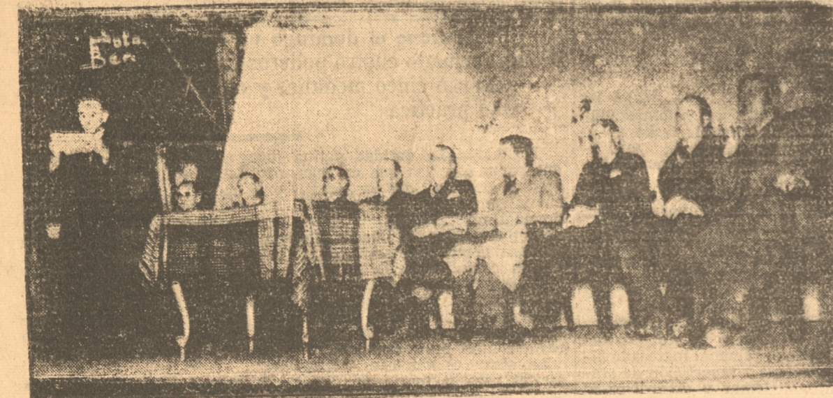
La mesa directiva que presidió la reunión de la mañana de ayer.