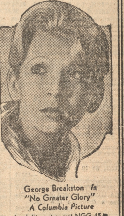
George Breakston in "No Greater Glory" A Columbia Picture 1 col. Star cut or mat NGG-45A DESDE HOY LOCALIDADES EN VENTA

Súper producción COLUMBIA, obra maestra del gran FRANK BORZAGE