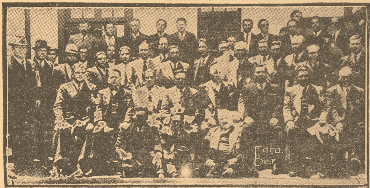
Los presidentes y secretarios de los directorios departamentales del Partido Demócrata y parlamentarios y candidatos de este partido, que asistieron a la reunión política celebrada ayer.

Acta levantada sobre esta interesante sesión