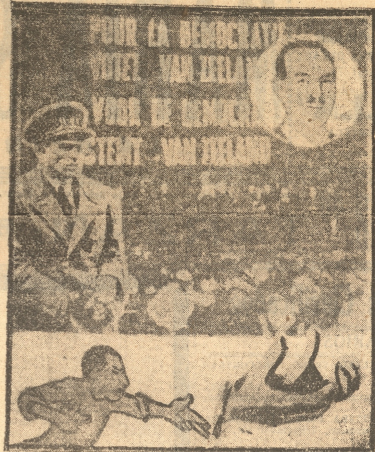
1. Uno de los afiches que tapizan las calles de Bruselas en que se proclama a Van Zeeland, campeón de la democracia. — 2. El Rey y Degrelle en acción. — 3. Gesto característico de las manos de Degrelle cuando habla a sus multitudes.

Cuando León Degrelle, el iracundo líder rexista de Bélgica, acusó hace poco al Premier Van Zeeland, de haberse enriquecido en negocios ligados con su Gobierno, el Jefe del Gabinete de coalición (católica, liberal, socialista), respondió ofreciendo abrir sus libros de cuentas a un tribunal investigador siempre que Degrelle hiciera lo mismo. Degrelle no volvió a tocar el tema. La prensa "democrática" (porque la lucha electoral de Bélgica que se decidirá en las urnas el 11 de abril es una guerra entre el fascismo y la democracia), se apresuró a repetir que Degrelle no podía someterse a una compulsión de sus fondos porque Bélgica entera se impondría de que el movimiento rexista está financiado por Hitler.