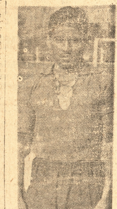
CAMION FLORES Fué el ganador absoluto de la primera rueda del Certamen profesional

El pasado domingo se efectuó en la cancha del Atlético Italiano el match de basketbol concertado entre el primer cuadro del Deportivo Fca. de Paños Concepción y el conjunto representativo de la firma Grace y Cia. de Chiguayante. El match formaba parte del programa con que se celebraba el noveno aniversario del importante establecimiento industrial ya nombrado.