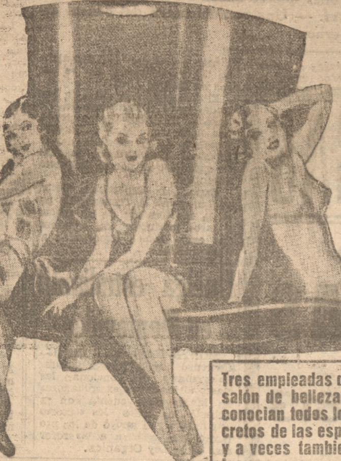
Tres empleadas de un salón de belleza, que conocian todos los se- cretos de las esposas y a veces tambien de los esposos.

Localidades en venta toda el día PLATEA... 3.40 Balcón... 2.40 Galería... 1.00