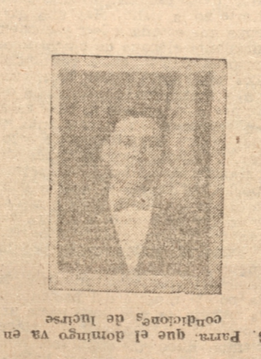
Parra que el domingo va en condiciones de lucirse.

El domingo se jugaron ciento treinta y nueve mil pesos.