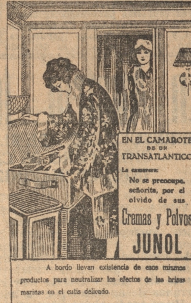
EN EL CAMAROTE DE TRANSATLANTICO