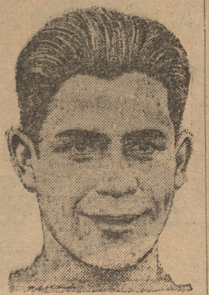
El nuevo idolo del box chileno

Lo que el campeón ha hecho después de su invicta gira por el Perú