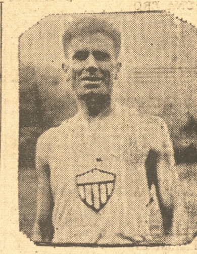
R O A El buen fondista de Concepción

con beneficio a la Cruz Roja local gesto que honra a la dirigente, pues a pesar de sus escasos medios, no ha trepidado en ayudar a una institución como la nombrada. La dirigente nos recomienda explicar que las entradas de año no son numerosas y se recomienda retirarse con anticipación pues su número es limitado. La posta con antorchas La gran novedad del programa extra es sin duda la carrera de Posta con Antorchas que se realizará mañana a las 21 hrs. partiendo desde el Municipio y recorriendo las calles principales para finalizar en el punto de la partida. Dos equipos del Club Arturo Prat de los Camillitas, dos del Juan de Dios Aguilera de los Lustrabotas y uno de la Fca. de Paños Concepción serán los encargados de dar lucidez a esta novedosa prueba.