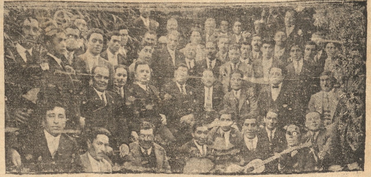
ASISTENTES AL LUNCH EFECTUADO EL DOMINGO ULTIMO CON MOTIVO DEL 24.º ANIVERSARIO DE LA UNION NACIONAL.

Torneo de rayuela En el amplio local que posee