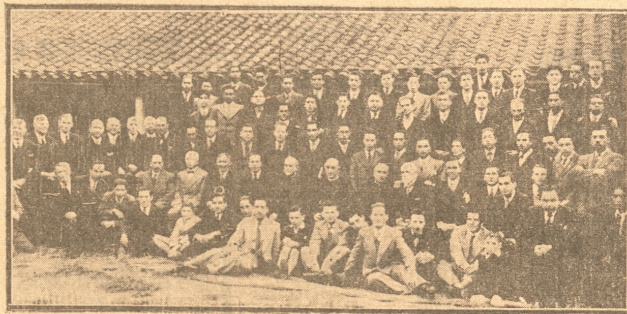
UN GRUPO DE LOS ASISTENTES A LOS EJERCICIOS ESPIRITUALES

Fué conmemorada ayer en los templos la Resurrección de Jesucristo.— Finalizaron los Ejercicios Espirituales