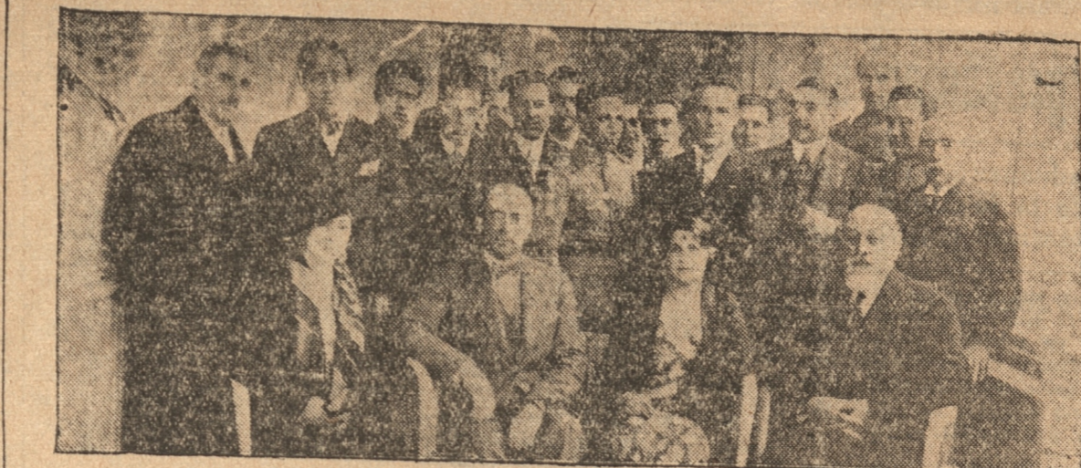
DURANTE LA RECEPCION EN EL CONSULADO ARGENTINO