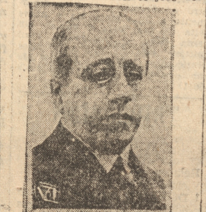
El señor Azaña, que ha sido llamado a Madrid

MADRID, 27.— (UP.) — United Press ha sabido que la designación de don Ricardo Samper, como organizador del nuevo Gobierno la hizo el Presidente don Niceto Alcalá Zamora de acuerdo con el jefe del