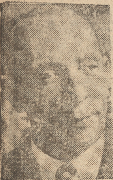
Señor Ricardo Samper, en cargo de organizar el nuevo Gabinete

El Presidente Alcalá Zamora designó al señor Ricardo Samper, radical valenciano, para que organice el nuevo Gabinete. Este busca la formación de un Ministerio de amplia concentración republicana. — Los señores Alba y Melquiades Alvarez han ofrecido su cooperación. — Hoy se dará forma al nuevo Gabinete