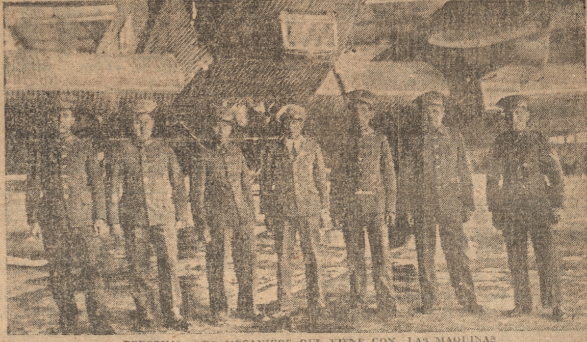
PERSONAL DE MECANICOS QUE VIENE CON LAS MAQUINAS