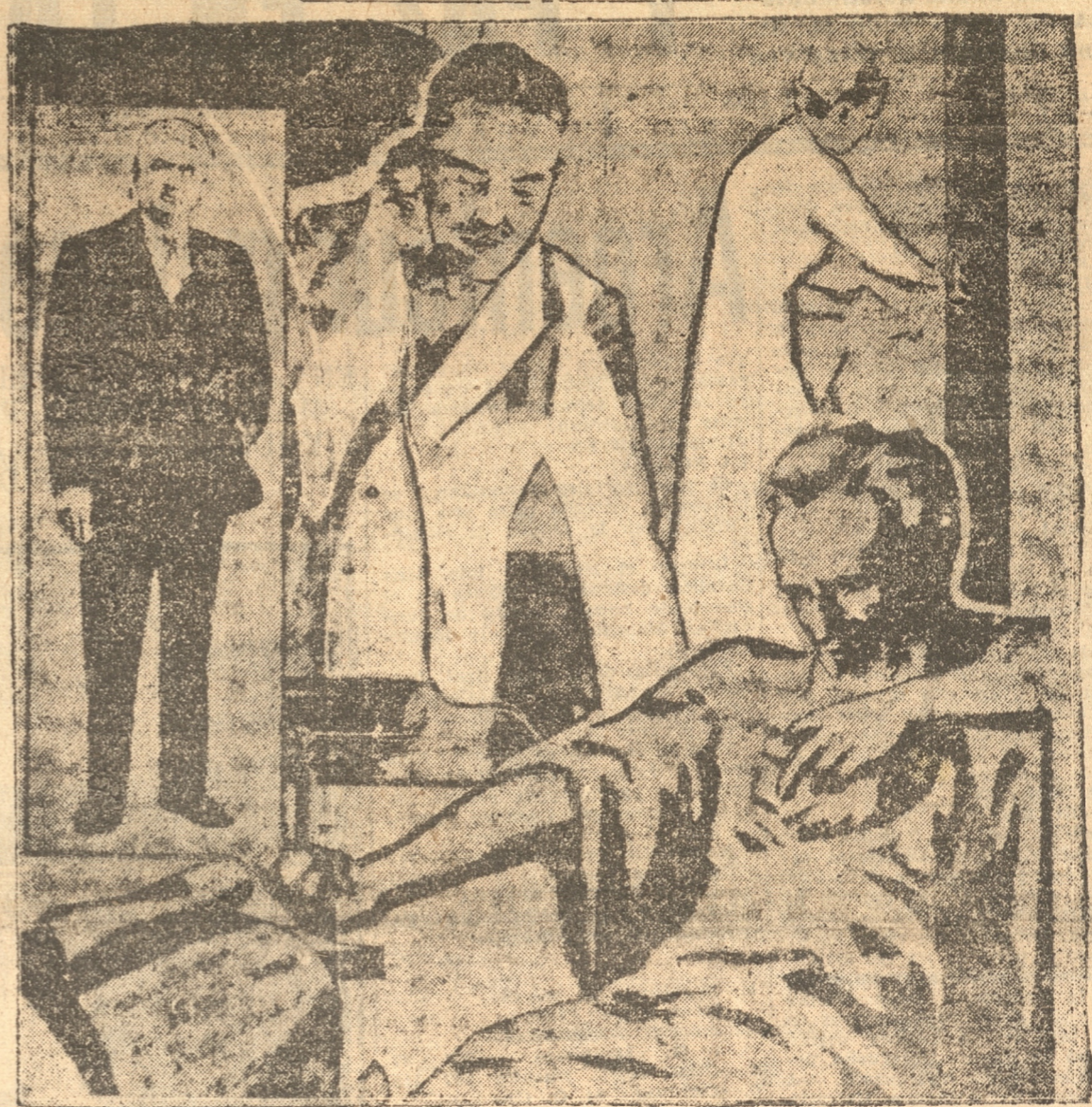
AL FONDO UN MEDICO MODERNO Y ESCULAPIO. — SOBREPUESTO EL DOCTOR MAYO, DE LA FAMOSA CLINICA DE ROCHESTER, QUE COLABORO EN LA REDACCION DEL INFORME QUE TRAE REVUELTO AL MUNDO MEDICO DE LOS ESTADOS UNIDOS