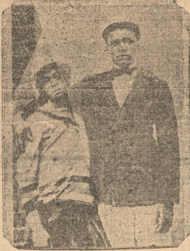
El fiel negro Saimmy, que siguió al emperador en desgracia a su exilio, con su no menos fiel y no menos negra esposa

Pero ese agotamiento de los depredadores del Atlas, de Marruecos y del Sudán no podía prolongarse impunemente. Los ingleses y los franceses empezaron a organizar expediciones punitivas, caravanas armadas, que tenían sobre los ladrones berberiscos la ventaja de las armas modernas y la organización y la disciplina, racionales y perfeccionadas. Las cábilas rebeldes, los nómades piratas estaban descomulgados, y ya iban rindiéndose, invocando al íman de los conquistadores europeos.