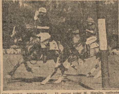
UNA FOTO HISTORICA. — El mayor señor M. Morales, capitaneado de Polo jugado en Valparaiso. El que viene tras él es nada menos que el Principe de Gales.

El equipo de los Mapuches ganó al Reg. Guías que le daba gran handicap. — Los señores Morales y Saavedra, los mejores hombres de la cancha. — Este deporte ha entrado en franca jornada de resurgimiento. — Datos generales de la reunión de ayer tarde