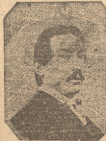
Jaime Lebaudy, que en el año 1910 fué asesinado, en Nueva York, por su esposa

Y en el puerto de Marsella, Jaime Lebaudy contrató a sus generales y almirantes: el peluquero Marais, el chancador Boulier, el maestro de escuela cesante Romie, el fabricante de cordajes Allais y el zapatero George Sarti. Este último era corso, ex bandolero, ex fraile, ex dentista, ex todo, pero siempre un vivo, valiente y enamorado de todas las cosas imposibles, de todos los cuentos imaginarios. Naturalmente, fué el zapatero Sarti el "gran mariscal" del futuro emperador del Sahara. Una vez reclutada la expedición de su marina, el estado mayor y las tropas de su ejército, Jaime Lebaudy los reunió a todos, en gran secreto, en un fondeadero mas vigilado de la costa de Argelia, donde los embarcó en un viejo barco auxiliar de la marina de guerra española: la Frasquita, comprada por 30.000 pesetas