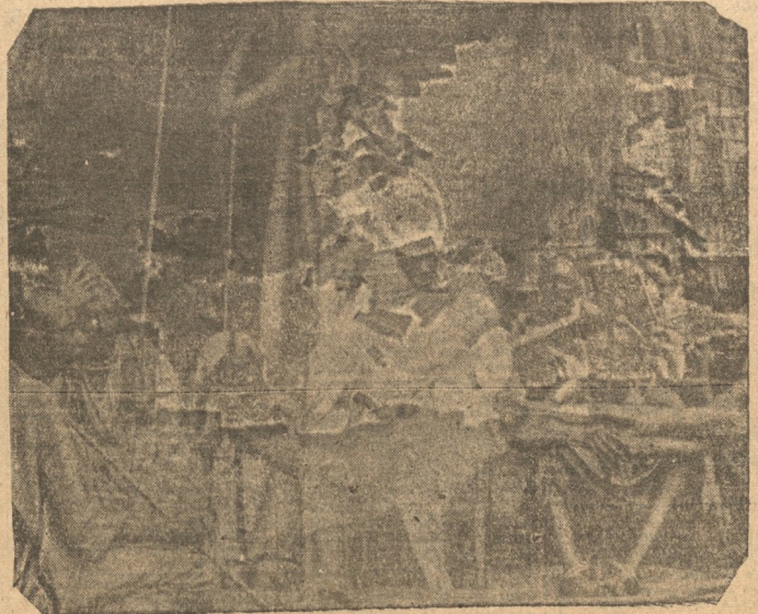
UNA REUNION DEL CONSEJO DE JAIMES I

ta pistola, que ella misma ni sabía si realmente estaba cargada con plomo. Terminó así, con un epílogo mediocremente trágico, la breve y deslumbrante existencia de ese héroe de teatro, de ese aventurero llegado con atraso de algunos siglos para incorporarse a su residencia real e ideal: la de Las mil y una noches.