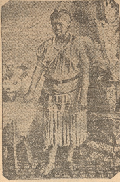
Sarti, el generalísimo de los ejércitos de Jaime I, tenía abundantes esposas negras; ésta es una de ellas, con atavío de gala

La marcha al borde del desierto duró nueve días, hasta que apareció un vasto oasis, en el que se habían reunido como mil o mil doscientos ladrones de toda procedencia, que tributaron a Lebaudy una acogida fantásticamente triunfal. Se celebró el acontecimiento con un festín, en el curso del cual fueron sacrificados dos rebaños de corderos y consumidos varios cajones de vinos de Francia, con el consiguiente y fácil emborrachamiento de los beduinos. La fantástica orgía — una caricatura de las noches de Nínive en pleno desierto del Sahara — se prolongó durante casi una semana, y concluyó con la solemne coronación de Jaime I, emperador del Sahara, al cual, los súbditos blancos y negros juraron fidelidad y obediencia.