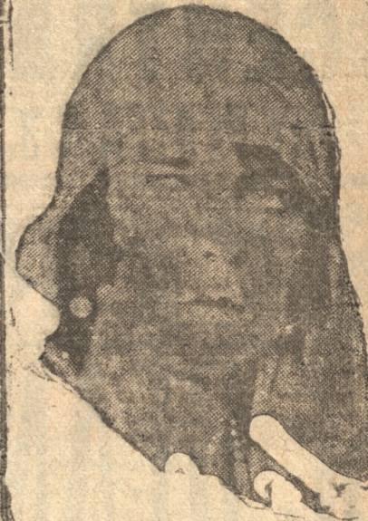
MARIA JOSE, de Bélgica, esposa del heredero italiano.