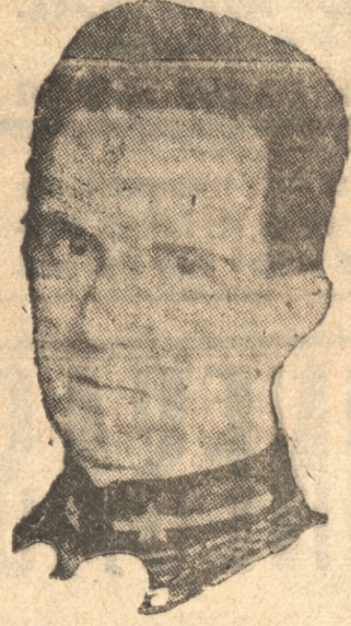
HUMBERTO DE SABOYA , heredero del trono de Italia.

El número de obreros ocupados en la última semana de junio p. p., resulta, según investigaciones efectuadas por el Ministerio de Corporaciones en 6.501 establecimientos, de 723 mil 552 con una disminución de 17.336 con relación al número de obreros ocupados en los mismos establecimientos durante la última semana de mayo de 1931 (740.886).