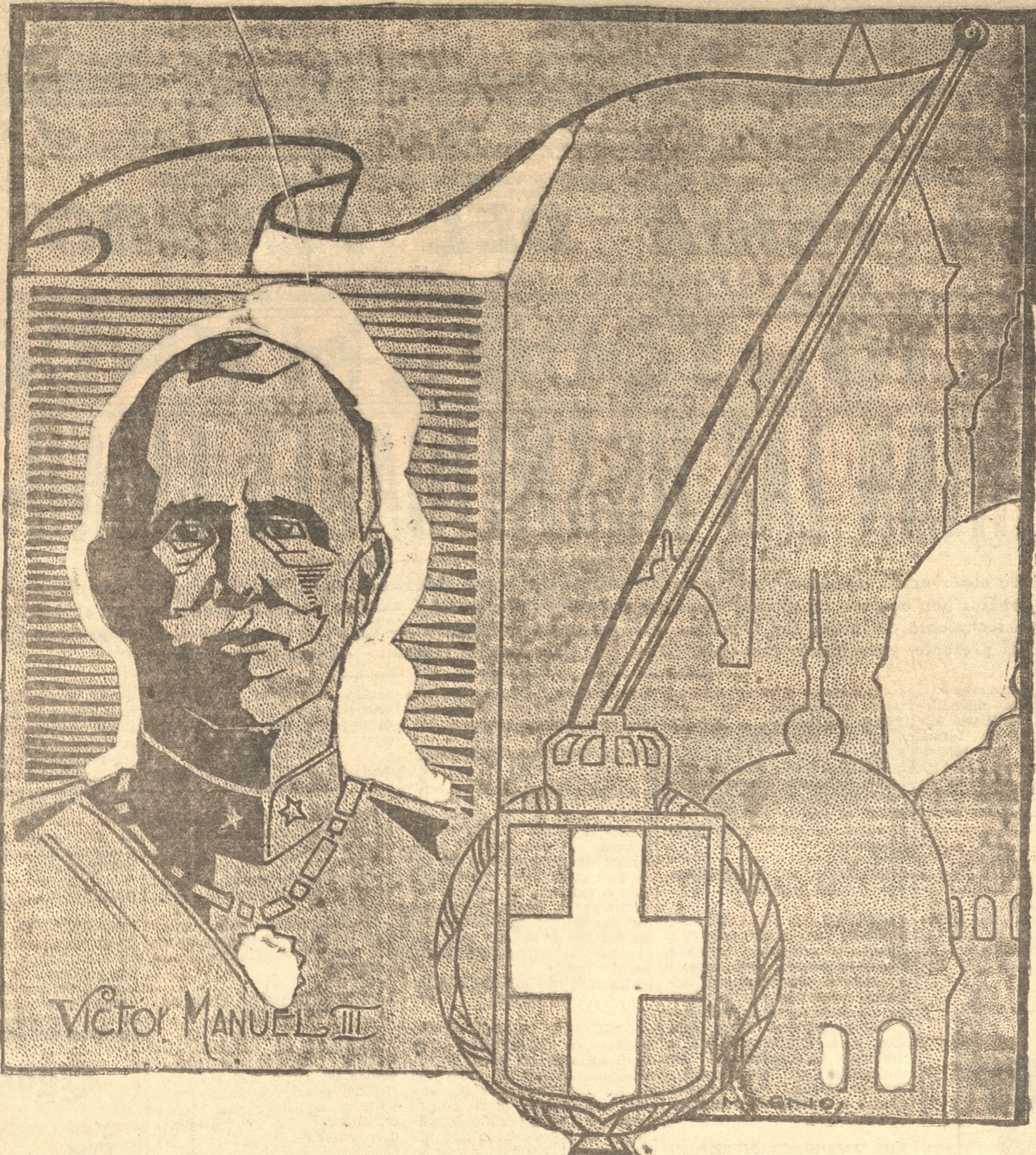
VICTOR MANUEL III

La circulación en billetes alcanzaba a 14.645 millones, con una disminución de 33 en relación al mes anterior.