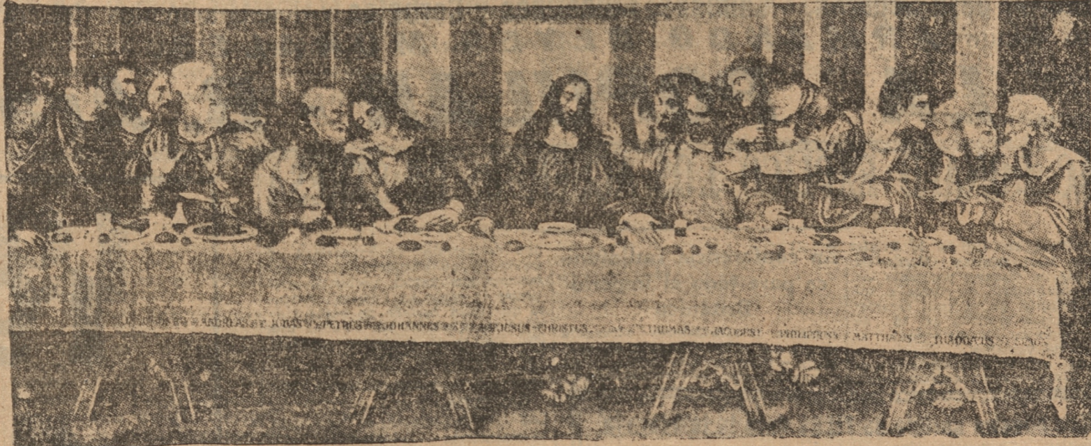
El Miércoles, Jesús no fue a Jerusalén. Fue el día entero en Betania.