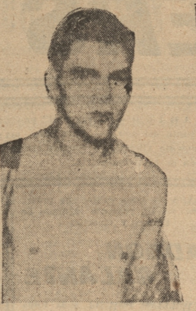
MAX SCHMELLING, es un hombre feliz