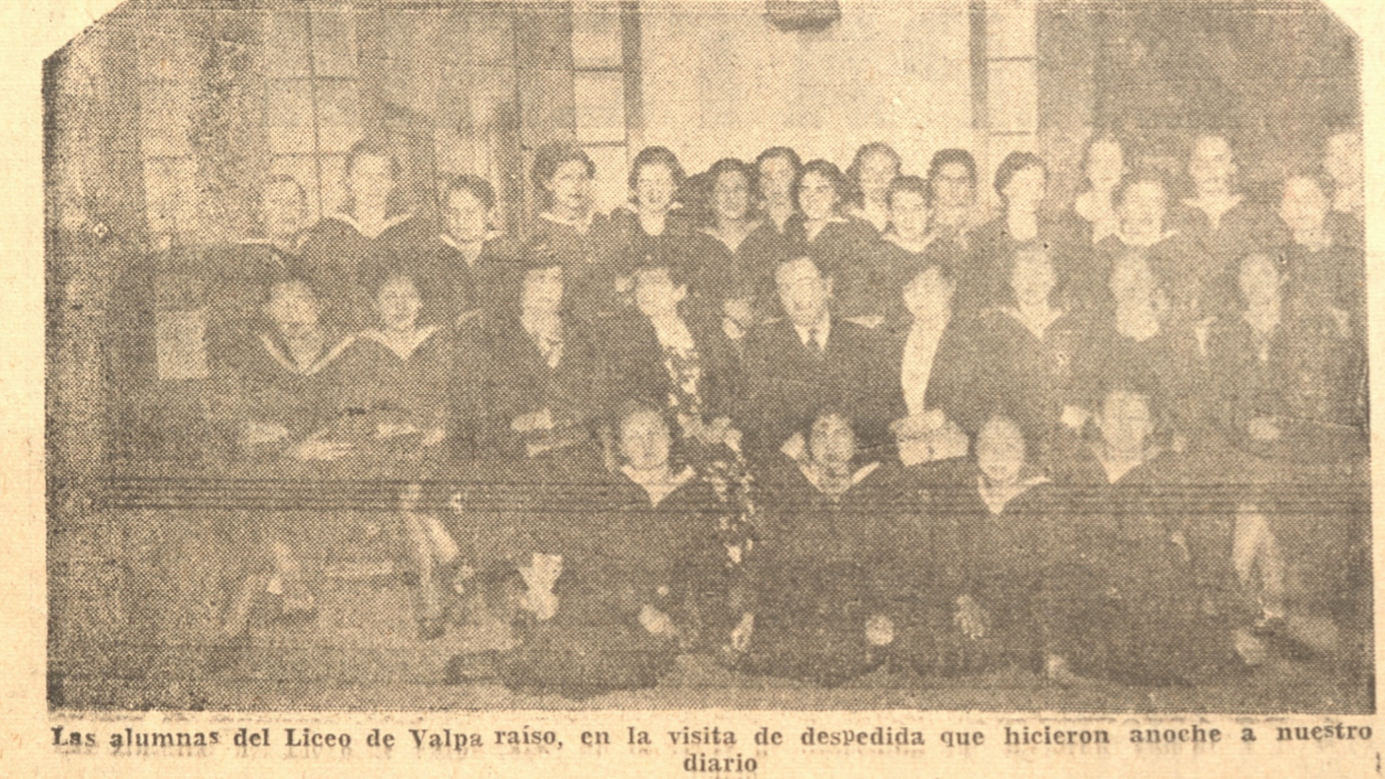
Las alumnas del Liceo de Valparaíso, en la visita de despedida que hicieron anoche a nuestro diario

Ayer visitaron a Lota, donde fueron gentilmente atendidas. — Se van muy complacidas de las atenciones de que fueron objeto