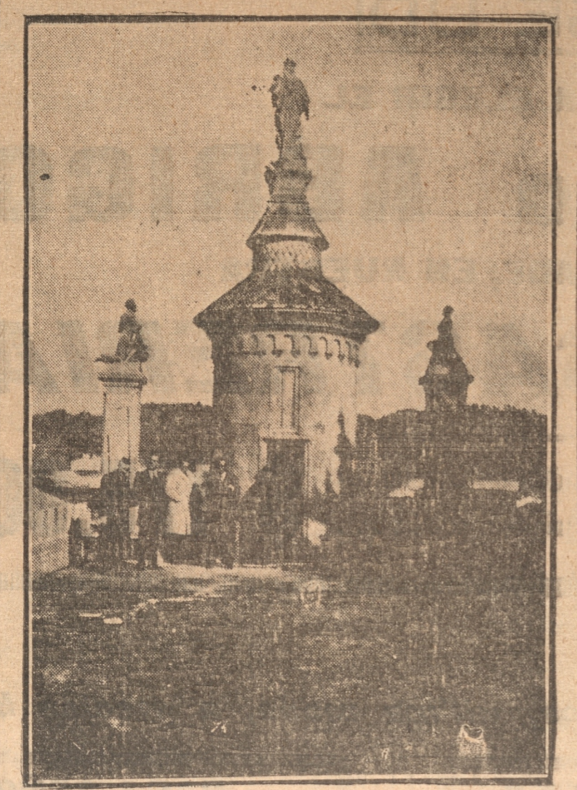
1.—Los periodistas, modernos escudriñadores de misterios, posan junto a la antigua torre del Castillo

Sobre la antigua construcción se yergue hoy un gran silencio.