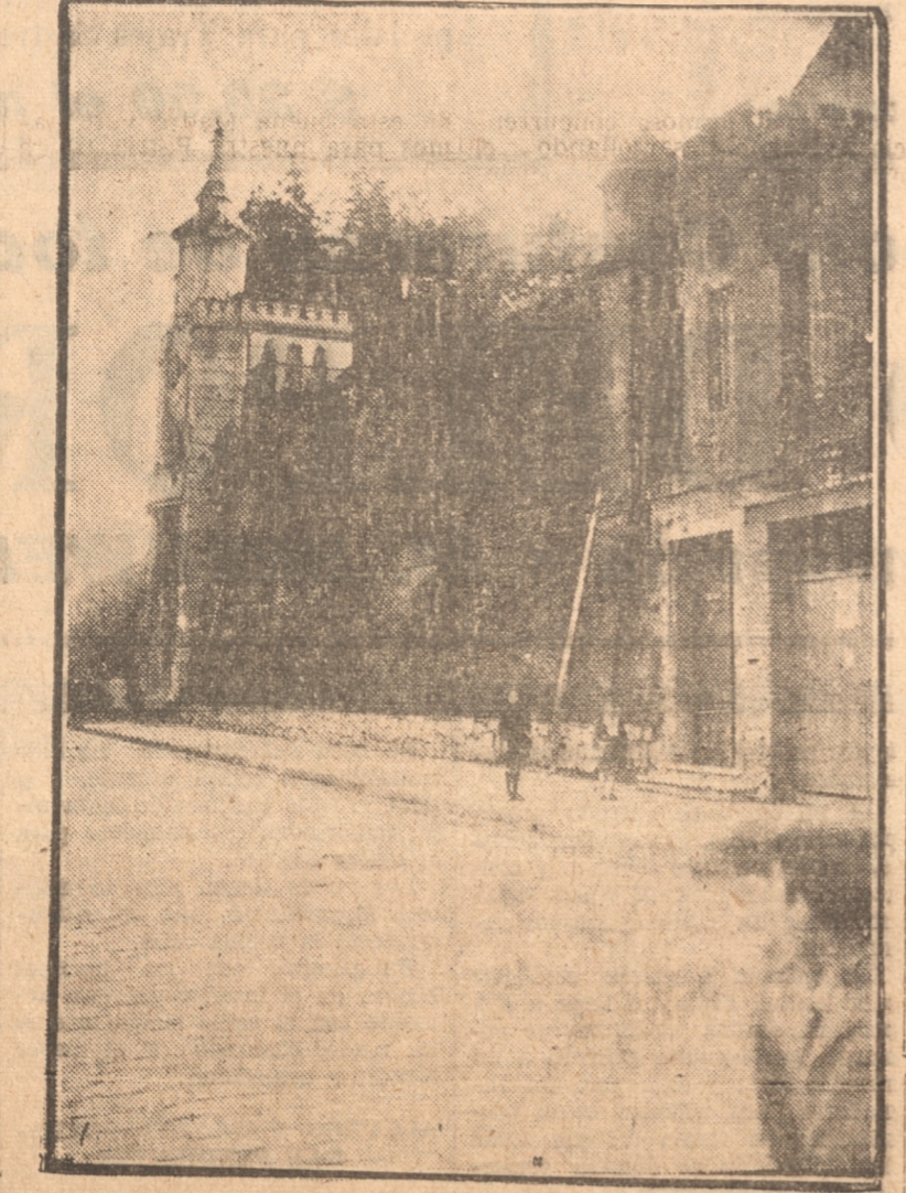
2.—No lejos del centro de la ciudad, el Castillo de Zulaica alza sus líneas magestuosas

—Aunque los arrendatarios actuales han respetado las líneas inmutables de la piedra y del ladrillo, que trazara su constructor, ya no tiene el castillo el ambiente de antaño.