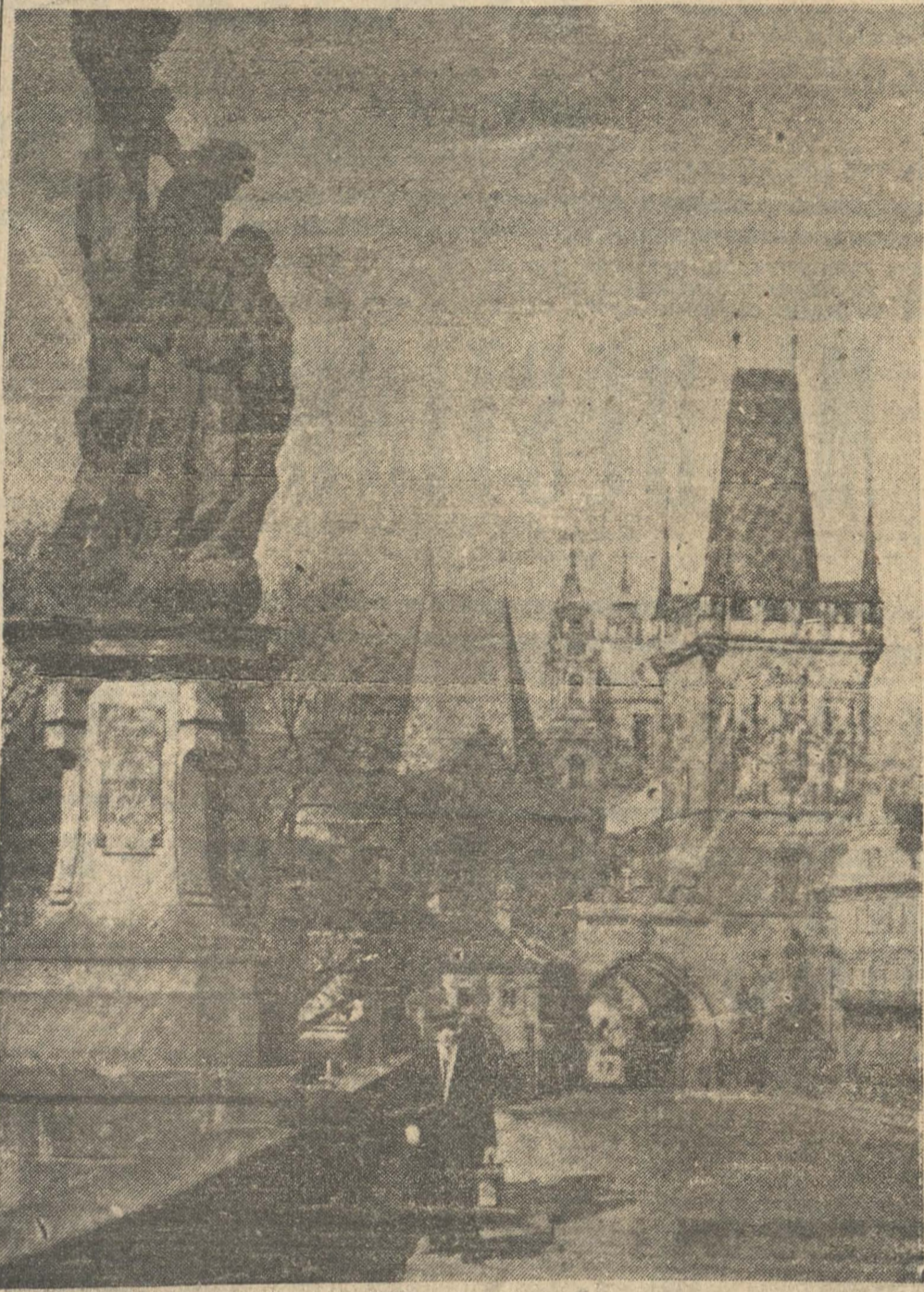
UNA VISTA DE PRAGA. — Ayer, en la plaza Wenceslao de la antigua capital de Checoslovaquia, se efectuó un desfile militar para celebrar el primer aniversario del establecimiento del Protectorado alemán en Bohemia y Moravia

HELSINKI, 15. — (U. P.) — Se anuncia que el Presidente de la República, Kallio, presentó el tratado de paz con Rusia a la Dieta para su ratificación. El anuncio no indicaba si el debate estaba terminado, pero informaciones anteriores filtradas de las reuniones secretas, indicaron que los parlamentarios han estado debatiendo acaloradamente desde que la proposición de paz llegó ante ellos para su consideración. No obstante la acre oposición, opinaban personas bien informadas que sin duda alguna el tratado sería ratificado. HELSINKI, 15. — (U. P.) — El Parlamento ratificó el Tratado de Paz con Rusia. HELSINKI, 15. — (U. P.) — Dice un anuncio oficial: "En la sesión plenaria de la Dieta celebrada hoy fué ratificado el tratado con la Unión Soviética por 145 votos contra tres. La sesión duró dos horas y media. La Dieta consta de 200 miembros".