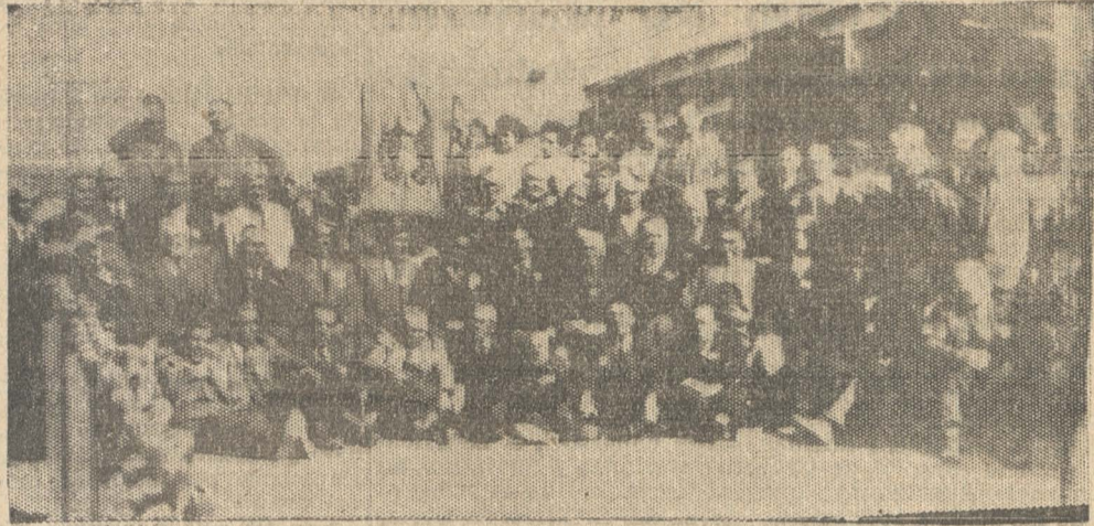
GRUPO DE ASISTENTES AL PASEO ANUAL DE LOS FERROVIARIOS JUBILADOS