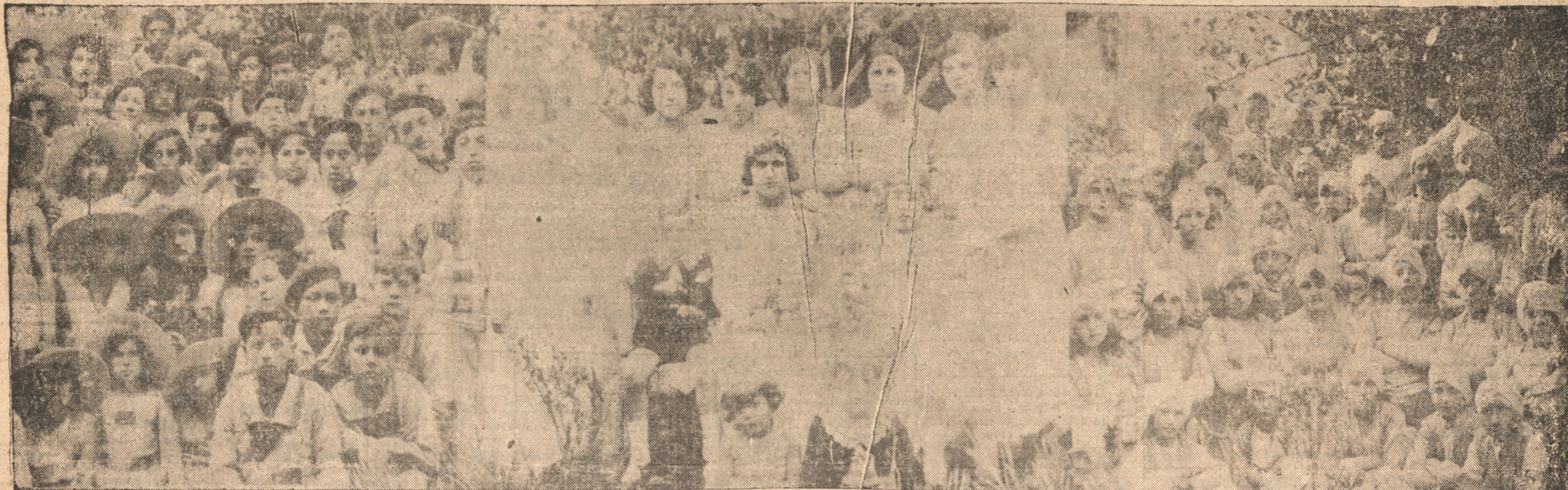
S. M. la Reina Mira y su Corte de Honor y dos comparsas en pose para "La Patria".