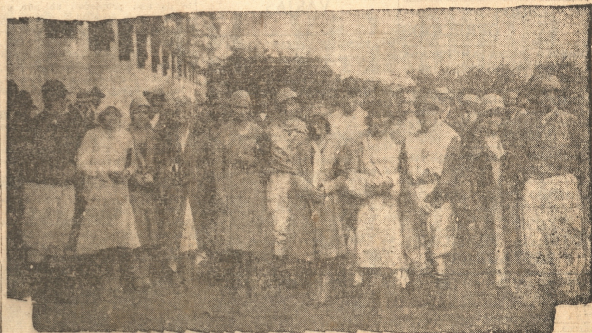
S. M. ACOMPAÑADA DE LOS JINETES CARALLEROS