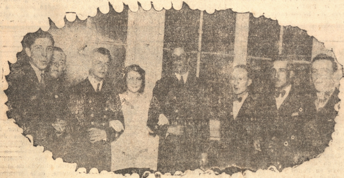
S. M. CON MIEMBROS DEL COMITE DE FIESTAS