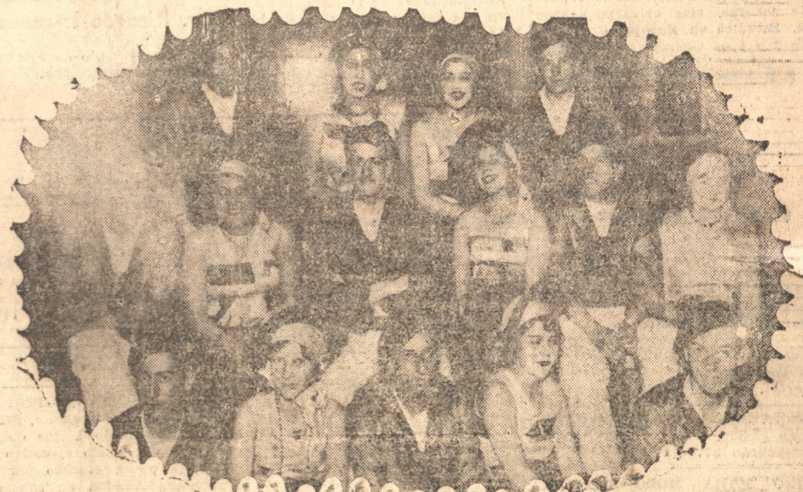
POSANDO PARA "LA PATRIA"

Una delegación del Sindicato de Obreros Metalúrgicos de Aconcagua entregó al Presidente Ibañez un memorial exponiéndole la situación angustiosa porque atraviesa la industria, la que se está viendo obligada a despedir trabajadores, los que se ven así amenazados por la miseria.