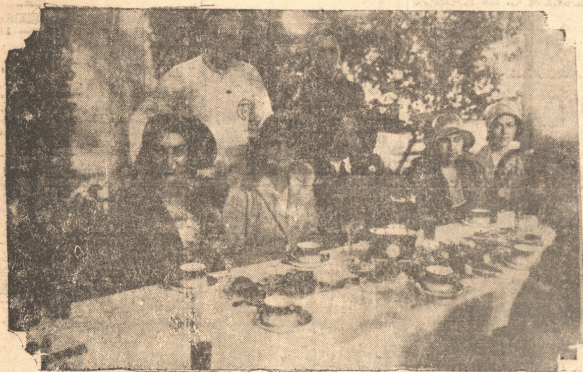
S. M. LA REINA LUZ CON LA REINA BLANCA DE CONCEPCION