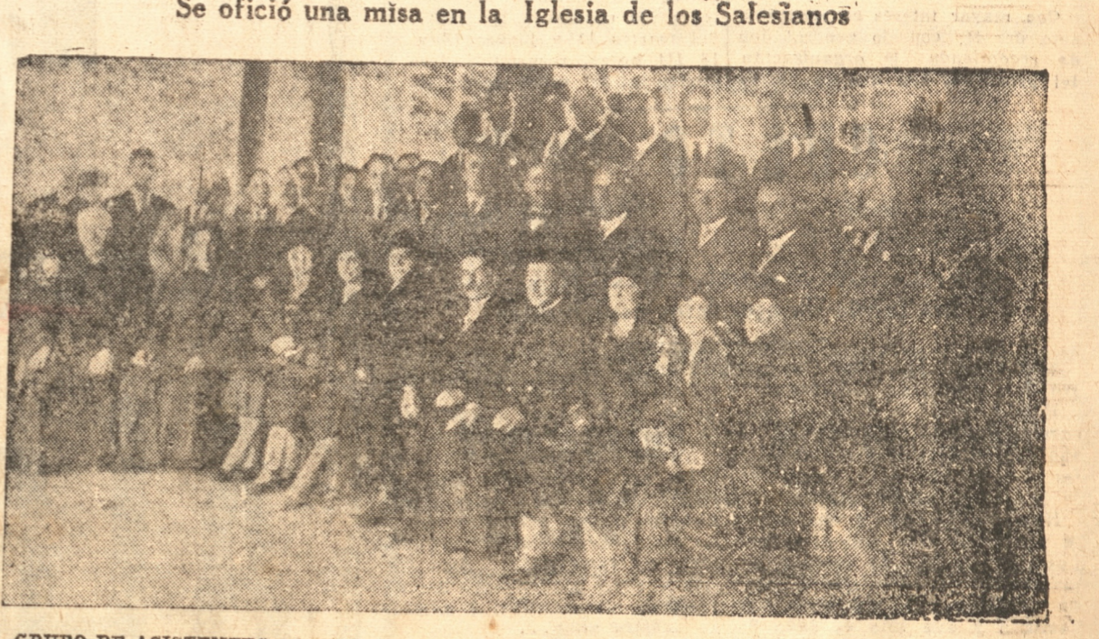
GRUPO DE ASISTENTES AL ACTO CELEBRADO AYER EN LOS SALESIANOS EN MEMORIA DE LOS CAIDOS EN LA GUERRA

Ayer se rindió un homenaje a los italianos caídos en la guerra. Se ofició una misa en la Iglesia de los Salesianos