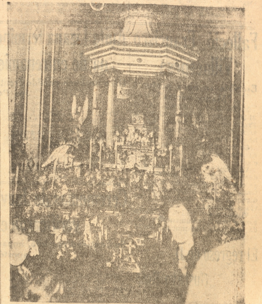
Como es tradicional, numerosa concurrencia de fieles visitó durante el día de ayer las diversas Iglesias de la ciudad con el objeto de orar ante los Monumentos levantados en cada una de ellas.