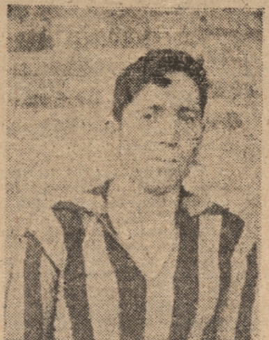
EL TANI, del Coquimbo