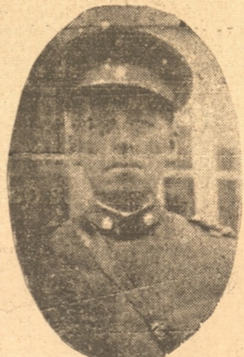
Jefe de la 3.ª Brigada de Caballería, Teniente Coronel Sr. Cood

Teniente de civil, — Asistencia obligatoria y lista según Reglamento.