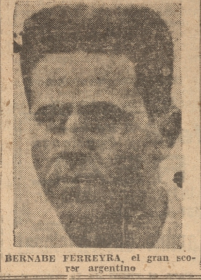
BERNABÉ FERREYRA, el gran scorer argentino

UNA DE GRANDES SCORERS El día de ayer fué de las "goledadas". Tres matches se resolvieron por cinco tantos en favor del que triunfó. Se marcaron en total 43