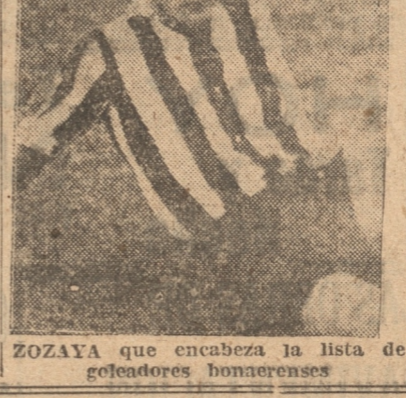
ZOZAYA que encabezó la lista de goledadores bonaerenses

de fútbol, debido a que la temporada de 1934, quedó terminada el día 18 del presente.