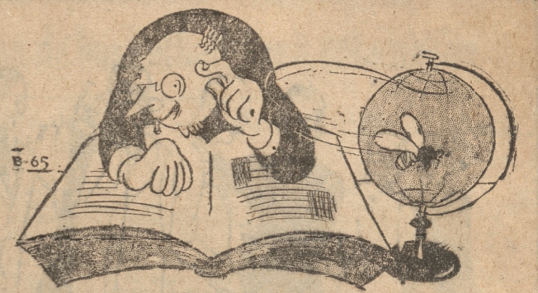
(De "El Romancero de l'ipo")

Habiendo llegado el término de la hora de fácil despacho, quedó pendiente la discusión de este proyecto.