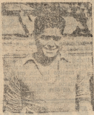
CHEIRO, EL GRAN AGIL ARGENTINO

Total, de estos tres clubes está el puesto de honor, es decir, los primeros del año pasado.