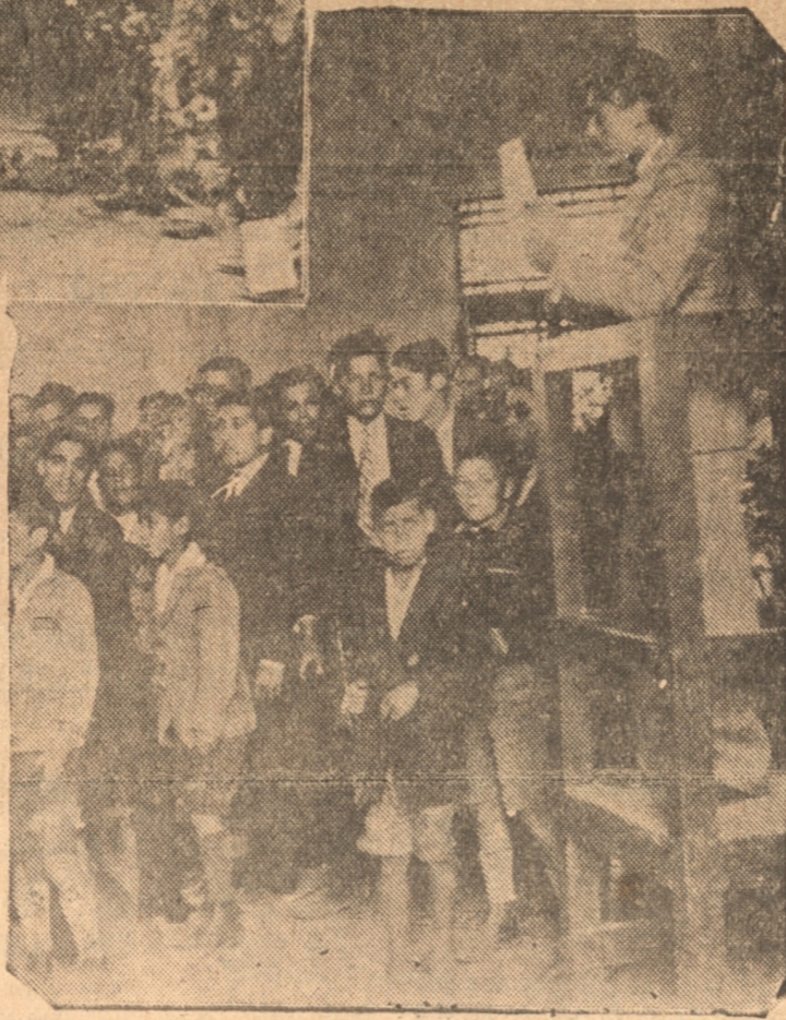
1) — LOS RESTOS EN LOS MOMENTOS DE SER SACADOS DE LA SOCIEDAD "UNION GRAFICA". — 2) — EL PRESIDENTE DE ESTA INSTITUCION PRONUNCIANDO SU DISCURSO EN EL CEMENTERIO

dejando paulatinamente girones de nuestras vidas en esas heladas y lluviosas noches de los inviernos crudos, y esto desgraciadamente es regla general para todos; ya seamos obreros del cerebro y pensamiento o ya seamos obreros de la parte mecánica de una empresa y caímos como siempre; silenciosos y muchas veces ignorada nuestra labor de informar a las multitudes ávidas de sucesos sensacionales y que siempre piden mayor esfuerzo informativo.