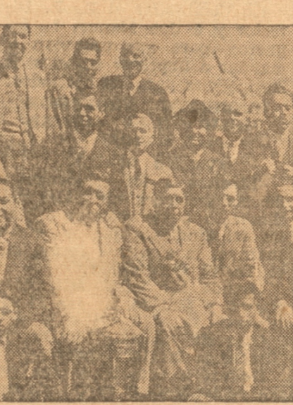
Grupo general de tiradores que actuaron en el Certamen por la copa Viña Vista Alba, efectuado el domingo pasado entre los clubes Tomé y Junge de Concepción