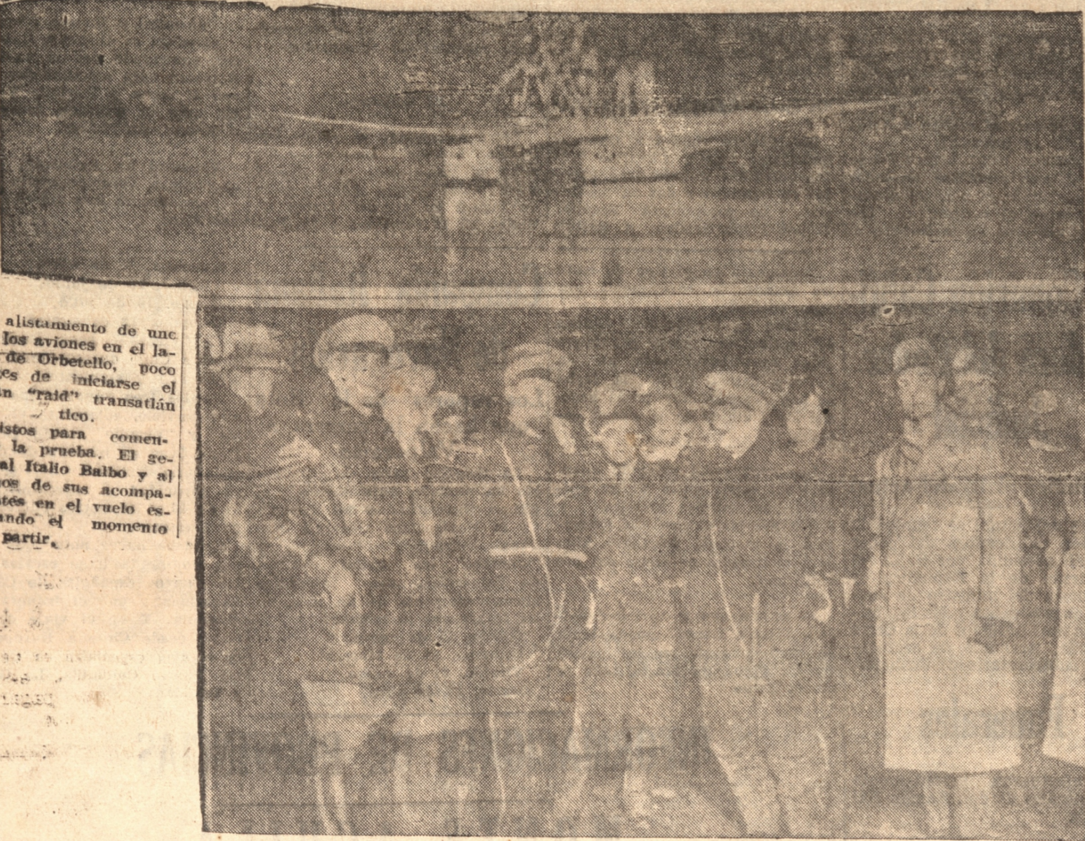
El alistamiento de uno de los aviones en el lago de Orbetello, poco antes de iniciarse el gran "raid" transatlántico. Listos para comenzar la prueba. El general Italo Balbo y algunos de sus acompañantes en el vuelo esperando el momento de partir.

EL MINISTRO BALBO OPINA SOBRE EL VUELO A CHILE RIO DE JANEIRO, 9. (U. P.)— El Ministro Balbo ha vuelto a insistir que los rumores sobre un vuelo de un hidroplano a Chile no tienen fundamento, diciendo: "No es verdad que ningún hidroplano vaya a Chile".