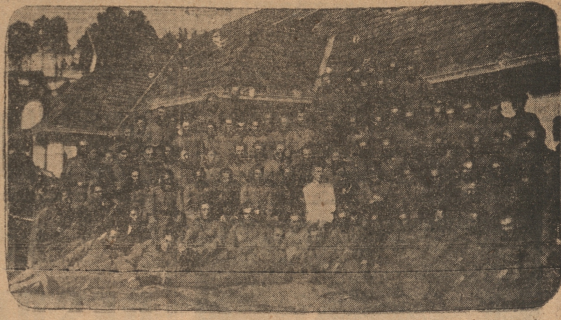
ASISTENTES AL PAPERCHASSE OFRECIDO AYER A LOS SUB OFICIALES DE LA ESCUADRILLA DE AVIACION