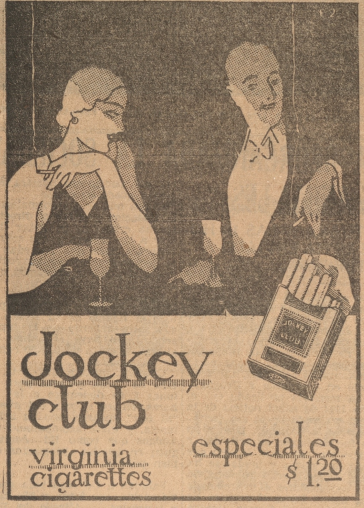
Jockey club virginia cigarettes especiales $ 1.20