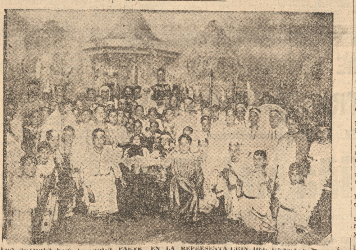
LOS NIÑOS QUE TOMARON PARTE EN LA REPRESENTACION DEL DRA. "LIRIOS Y PALMAS" EN LA VELADA