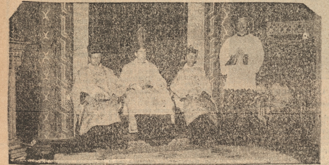
EL EXCMO. SR. FUENZALIDA, DURANTE LA PONTIFICIAL DE AYER EN EL SEMINARIO.